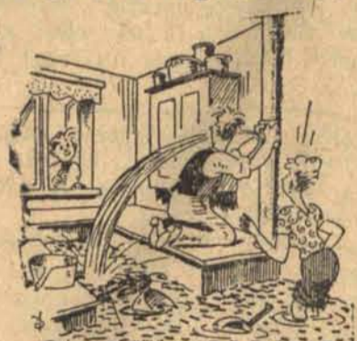
— Proszę pana, instalator może przyjść dopiero jutro rano!