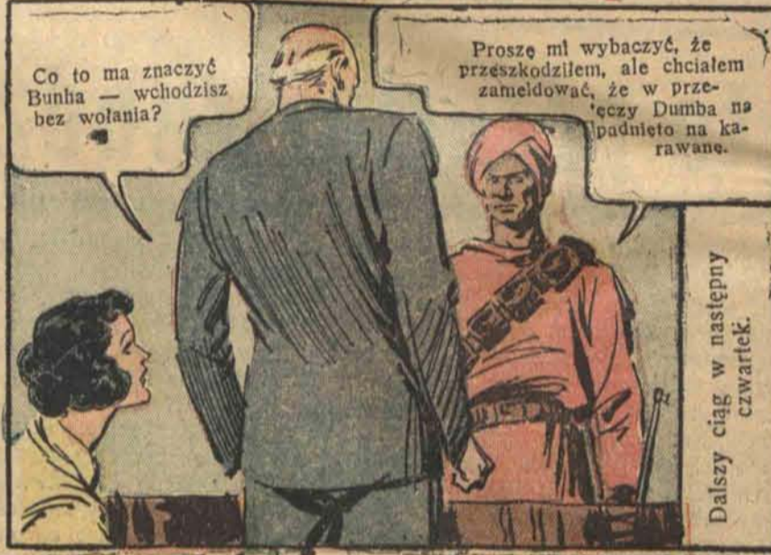
Dalszy ciąg w następnym czwartek.