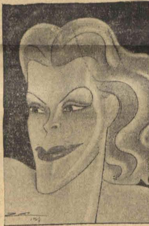
wschodząca gwiazda kinematografii.