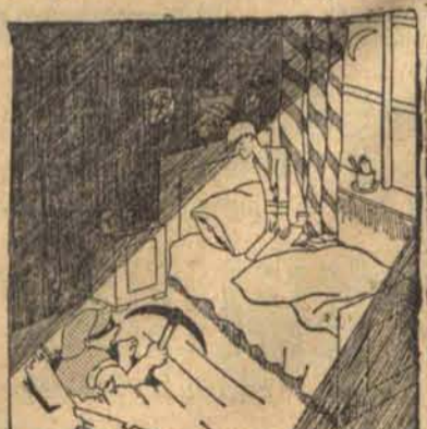
— Prze...przepraszam, ale zablądziłem! Myślałem, że to tutaj jest droga do banku!