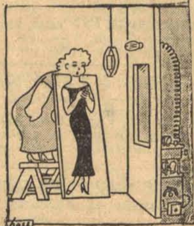
Śpiewaczka radiowa usiłuje oszukać oko stacji telewizyjnej.