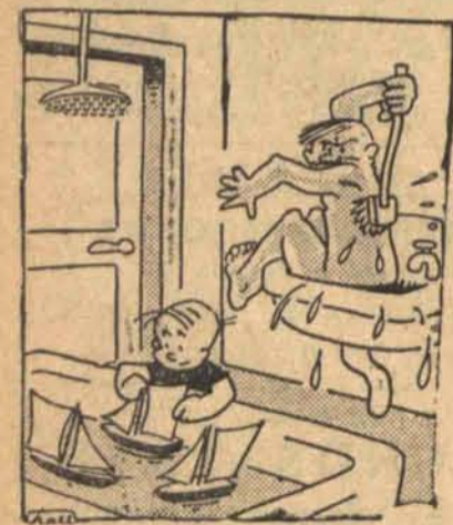
gdy synek się bawi.