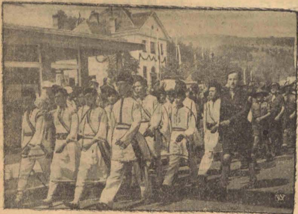
Na zdjęciu widzimy skautów rumuńskich w strojach ludowych, którzy maszerują ulicami uzdrowiska.