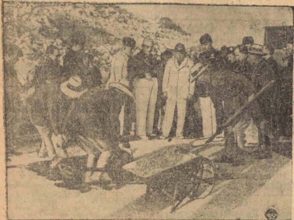
W czasie swej podróży na Sycylię Mussolini dokonał przeglądu robót prowadzonych na tej wyspie. Na zdjęciu widzimy Mussoliniego dokonującego przeglądu robót, prowadzonych przy budowie szosy.