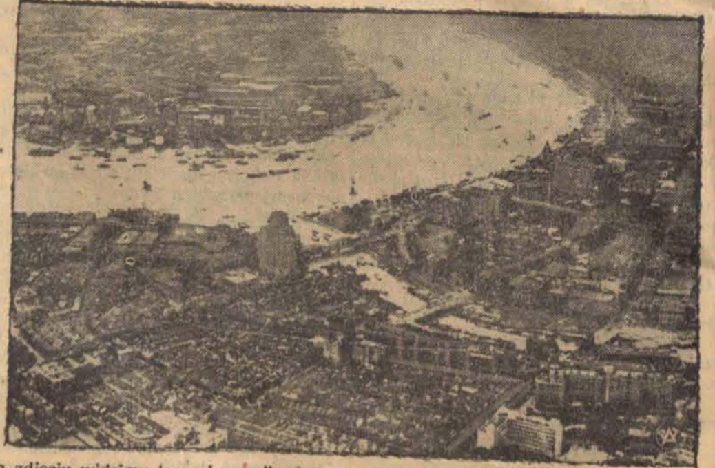
Na zdjęciu widzimy teren koncesji międzynarodowej w Szanghaju. W ostatnich dniach bomby rzucone z samolotów chińskich dokonały wielkich spustoszeń. W czasie nalotu zginęło około 1000 mieszkańców.