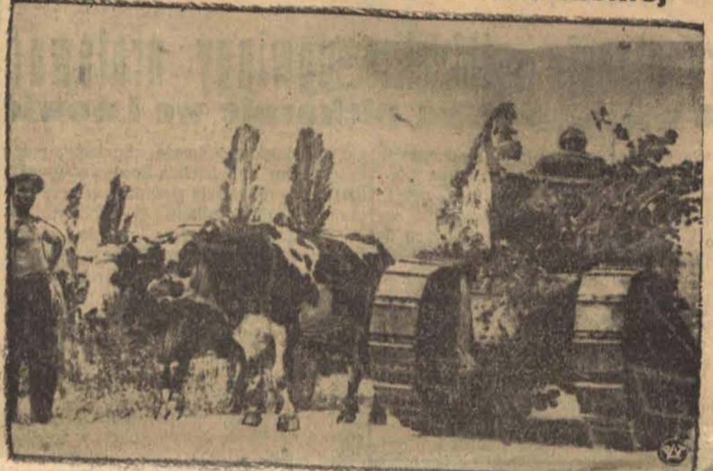
W ostatnich dniach armia francuska odbyła doroczne manewry w północno-wschodniej Francji. Zdjęcie przedstawia fragment z tych manewrów, a mianowicie zamaskowany czołg gałzkami drzew, który posuwa się po górzyściej drodze mijając wóz ciągnięty przez parę wołów.