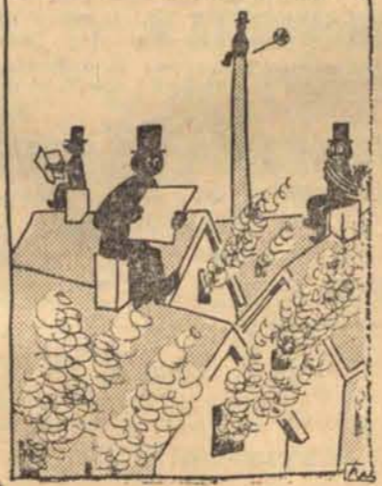
Kominiarze czekają na podwyżkę.