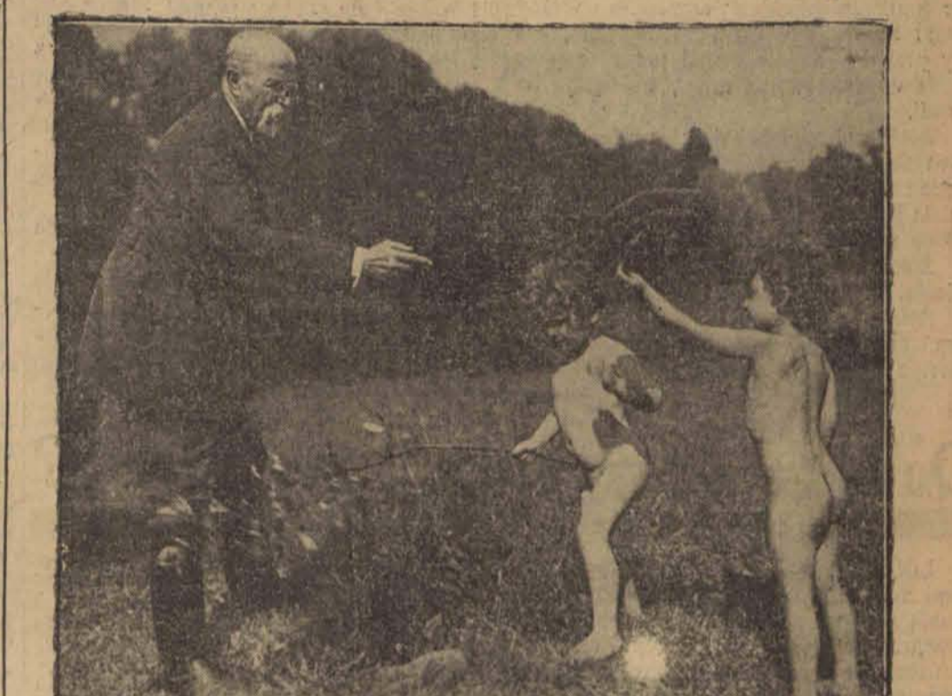
Na zdjęciu: B. prezydent Masaryk podczas zabawy ze swymi wnukami w parku zamku Lany.