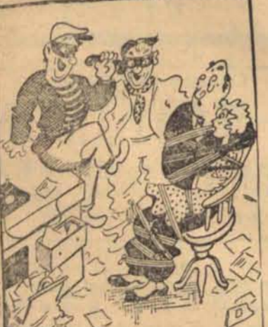
Bandyci w biurze: — Ile pan nam da, za to, że nie zadzwonimy do pańskiej żony.