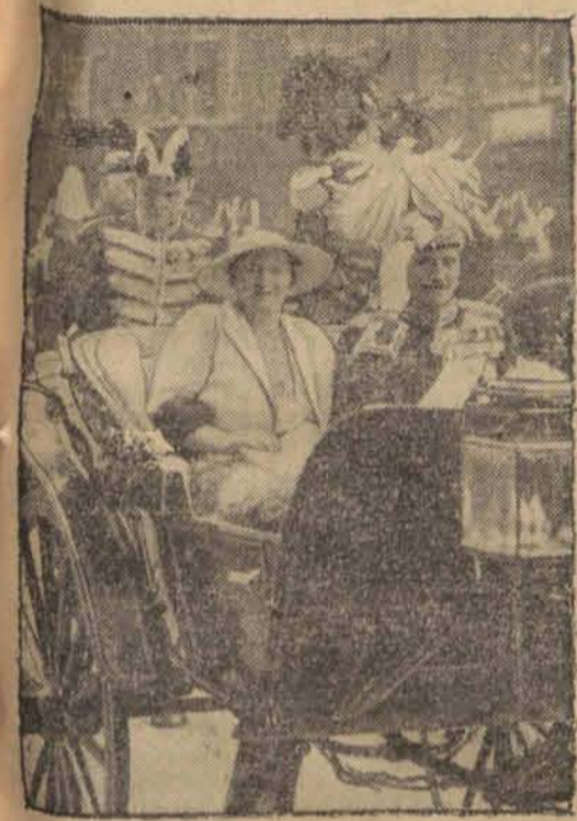
Królowa duńska Aleksandryna obok swego męża króla Krystiana X.

KOPENHAGA, 14.9. — Wkrótce po przewiezieniu królowej duńskiej do szpitala w Skagen dokonano operacji. Jak wiadomo królowa Aleksandryna zachorowała nagle na silne bóle jelit.