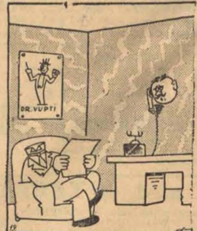
— Tak, tu mówi dr Vupti, król czarodziej.