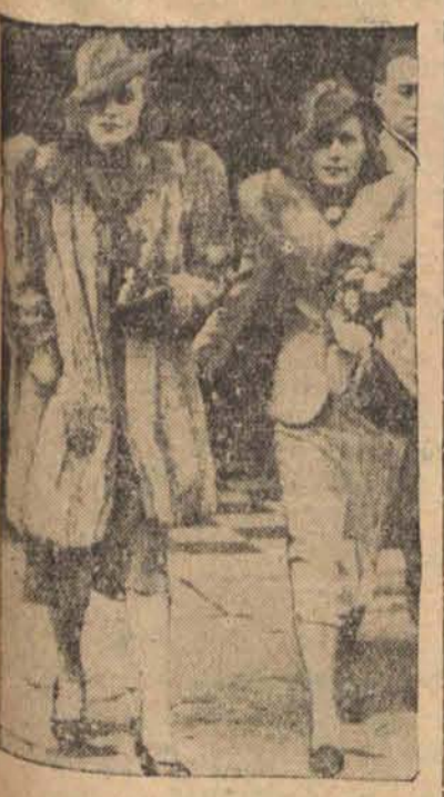
Na zdjęciu słynna gwiazda filmowa Marlena Dietrich wraz ze swą córką w tłumie ulicznym na ulicach Paryża.

Nie widział tylko tego, że w zakrystii stawało się coraz widniej. Nie widział, że oprócz dwóch zapalonych świec cała firanka wisząca wzdłuż wąskiego długiego okna jest jedną wielką jaskrawo i migotliwie żarzącą się lampą.