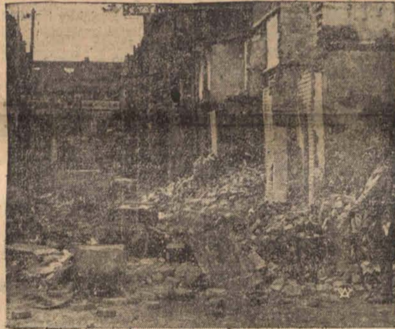
Rzut oka na gruzy wspaniałego dworca kolejowego w Szanghaju, który został zbombardowany i doszczętnie zniszczony przez lotnicze eskadry japońskie.