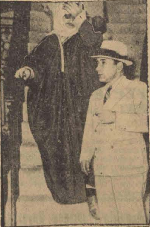
Wielki mufti Jerozolimy w przebraniu Beduina udaje się w towarzystwie komisarza francuskiej policji do miejsca internowania w Bejrucie (Syria).