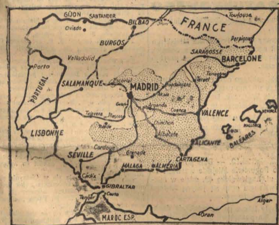
Po zajęciu Asturii z ogólnej liczby 50 prowincji Hiszpanii obecnie 35 znajduje się w ręku generała Franco. Kropkowany teren (15 prowincji) jest w ręku rządu walenckiego.