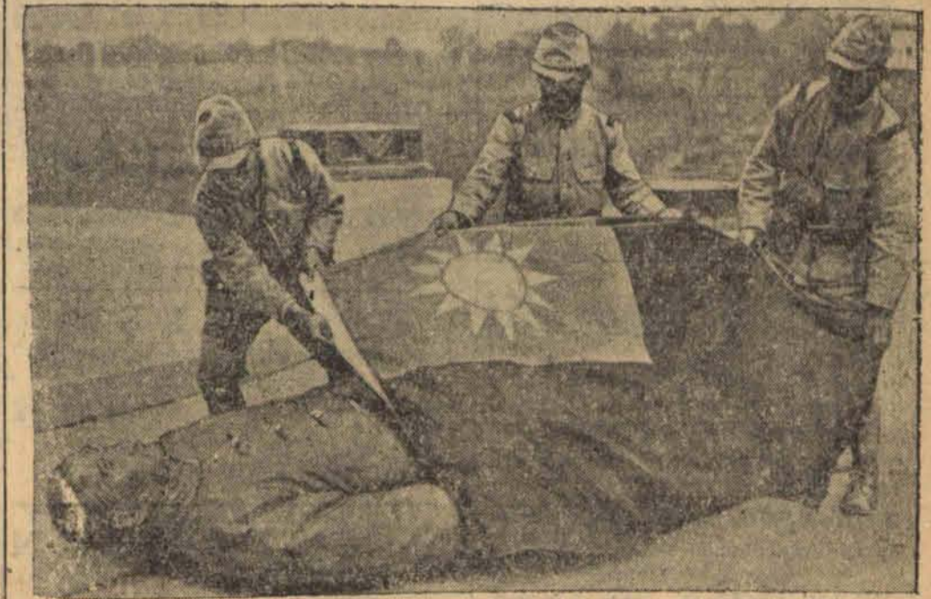
Japońscy żołnierze nakrywają stracony przez partyzantów posąg Sun-Yatsena flagą chińską.