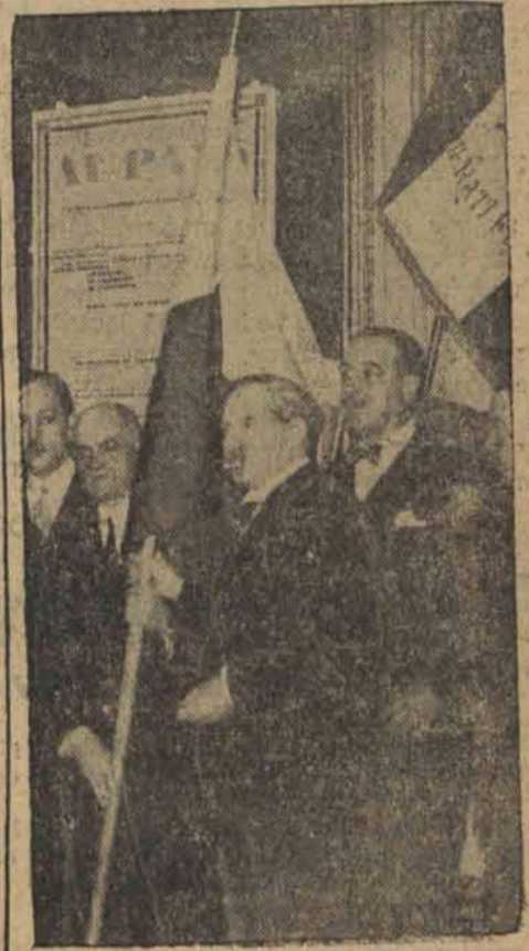
Moment wręczenia przez prezesa P.Z.O.O. gen. dr. Góreckiego sztandaru polskiego prezesowi konfederacji Narodowej b. kombatantów francuskich min. Rivollet, w Paryżu.