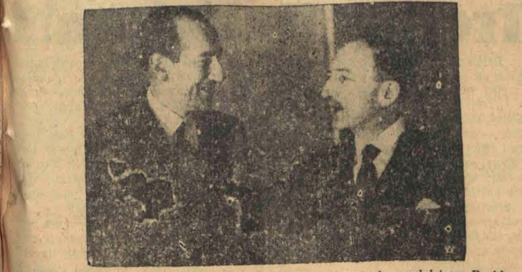
Minister Spraw Zagranicznych Francji Delbos w rozmowie z ministrem Beckiem w Warszawie.

POCIĄG NA DNE WĄWOZU. BARCELONA, 7. 12. — Pociąg zdążający z Walencji do Barcelony zderzył się między stacjami Freixenada i Planes de Montsia w prowincji Tarragona ze stojącym na torze wagonem. Lokomotywa wykołysła się i wraz z wagonem bagażowym i dwoma wagonami trzeciej klasy spadła na dno wąwozu. 12 osób zginęło, 60 zostało rannych.