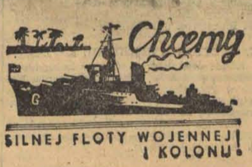
SILNEJ FLOTY WOJENNEJ I KOLONIJ

BEZŁADNY ODWRÓT. TOKIO, 7. 12. — Armia japońska znajduje się w odległości 1 km od Nankinu, który od wczoraj stoi w płomieniach. Chińczycy porzucili wszystkie swe stanowiska i znajdują się w bezładnym odwrocie, ścigani przez samoloty japońskie.