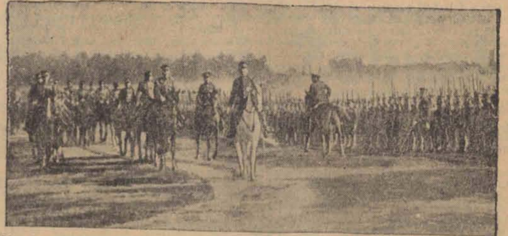
Na placu ćwiczeń Yoyogi koło Tokio cesarz Japonii Hirohito (na białym koniu) odbył przegląd 17.000 żołnierzy, którzy udają się do Chin. Po przeglądzie odbyła się defilada.