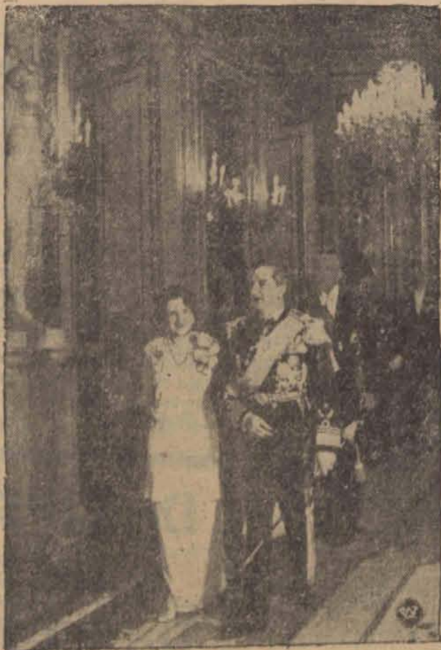
Na cześć Regenta Horthy'ego odbył się na Zamku Królewskim w Warszawie galowy obiad. Na zdjęciu: orszak dostojnych gości udaje się do sali jadalnej. W pierwszej parze idzie Regent Horthy wraz z Małżonką Prezydenta R. P. p. Marią Mościcką, dalej postępuje Prezydent Rzeczypospolitej