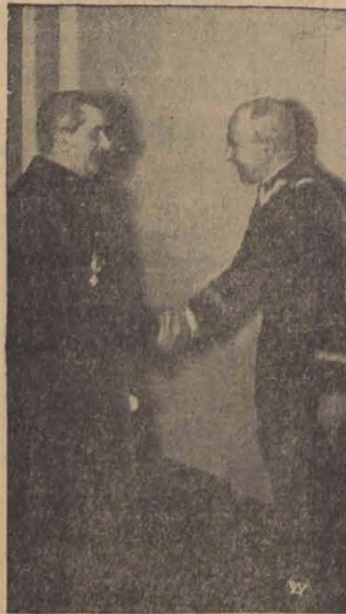
Regent Węgier admirał Horthy odwiedził Marszałka Śmigłego-Rydza, w mieszkaniu przy ul. Klónowej. Na zdjęciu moment powitania Jego Wysokości przez Marszałka Śmigłego-Rydza.