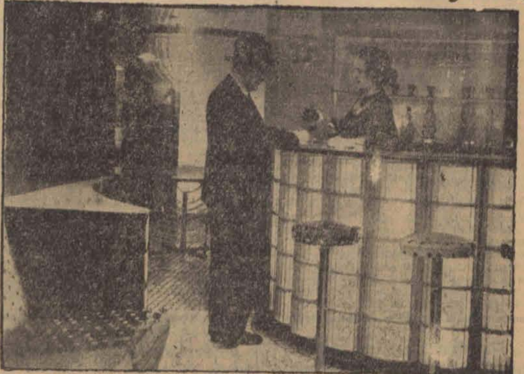
W Londynie została otwarta wielka wystawa szklana, na której widzimy urządzenie baru, całkowicie wykonane ze szkła.