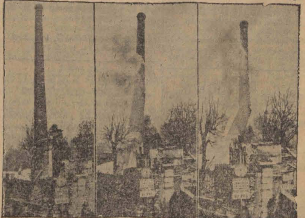
W Charenton nad Sekwaną zwalono komin fabryczny wysokości 50 m, który stanowił niebezpieczeństwo dla samolotów, startujących z pobliskiego lotniska. Na zdjęciu 3 fazy eksplozji ładunku dynamitu.

Z całej Polski płynie ku Rodakom za granicą wołanie: „Myślą i sercem jesteśmy z Wami”