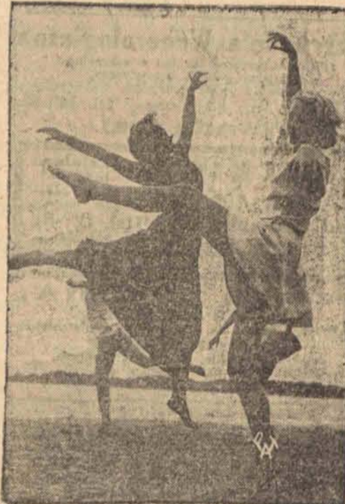
Bez tańca ani rus