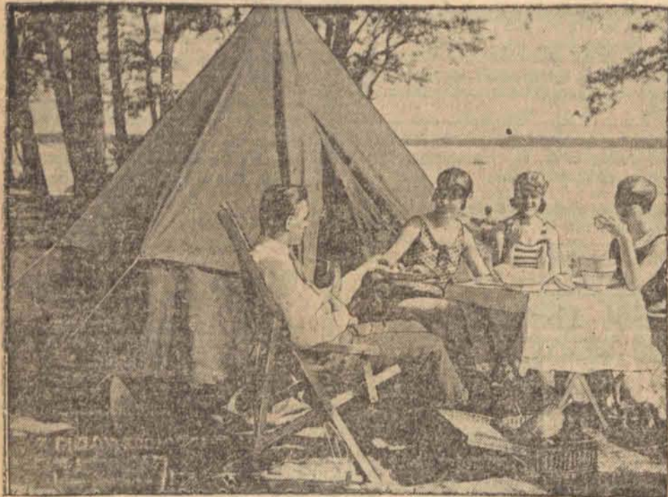
Wycieczka na sposób angielski.