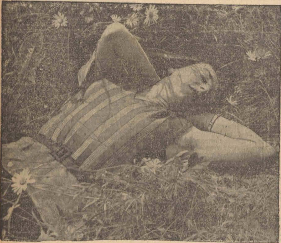
Smaczna drzemka w cieniu drzew.