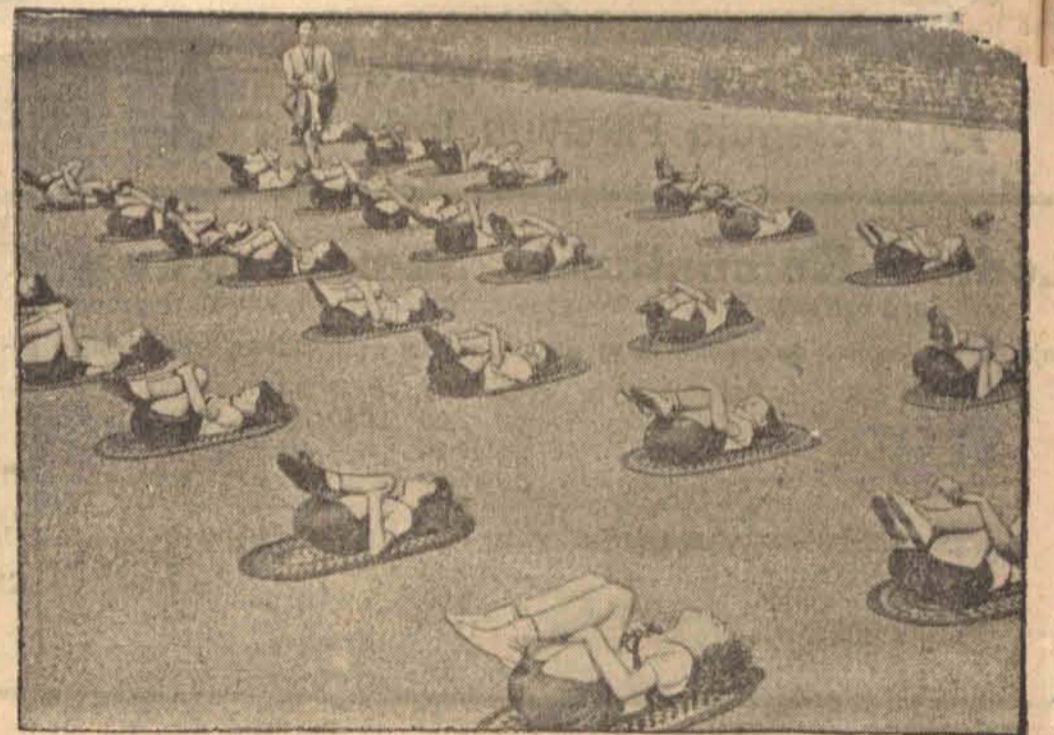
Lekcja gimnastyki na świeżym powietrzu