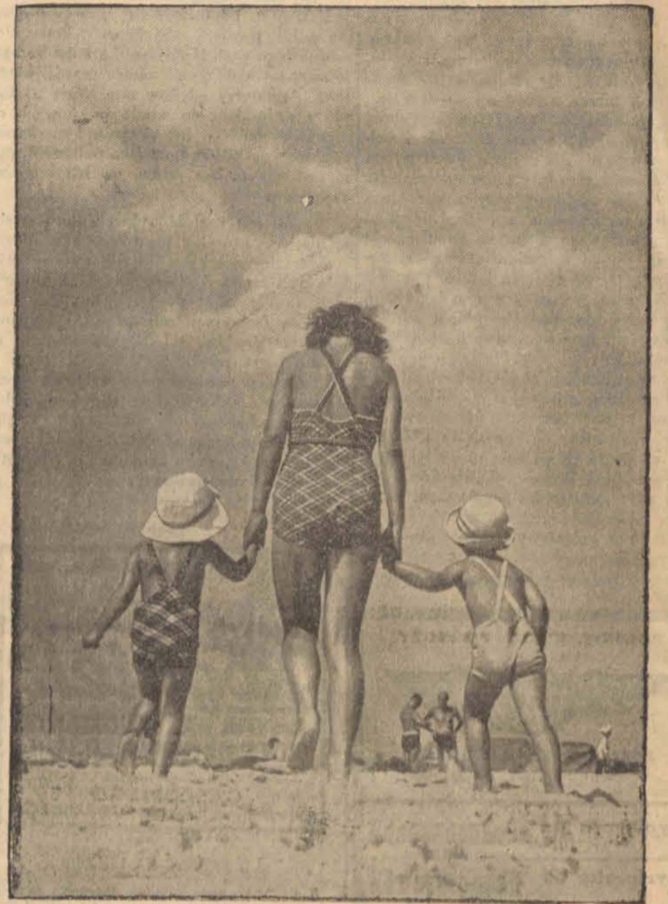
A marnotrawi wspaniałe nie trzeba — są dzieci, jest słońce!