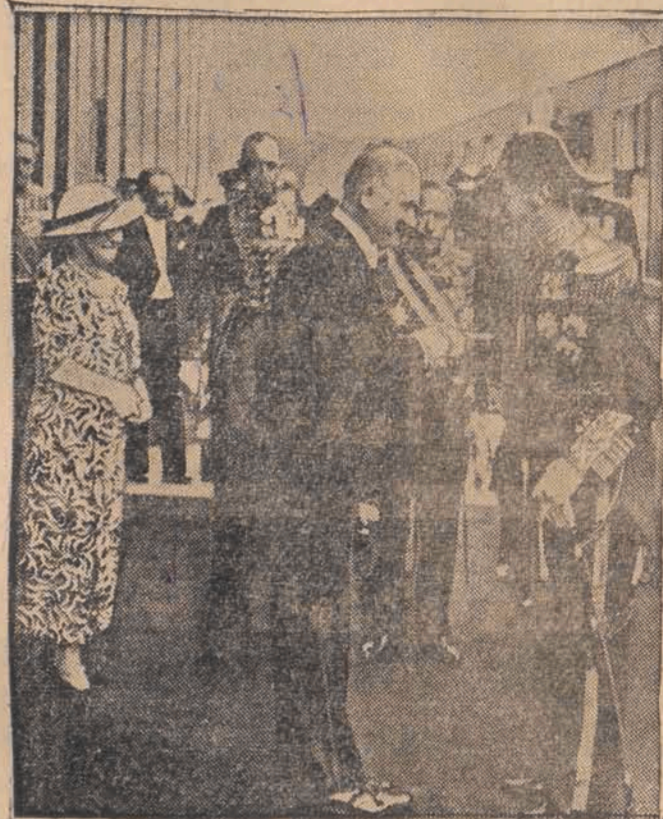
Prezydent Lebrun uściskiem dłoni wita monarchę zaprzyjaźnionego imperium.