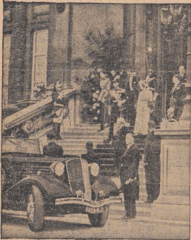
Król Jerzy w towarzystwie małżonki opuszcza Quai d'Orsay.