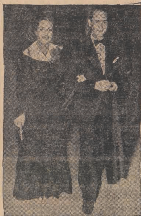
Filmowe małżeństwo Franchot Tone — Joan Crawford zelektryzowało opinię publiczną w Hollywood oświadczeniem o zamierzonym rozwodzie.