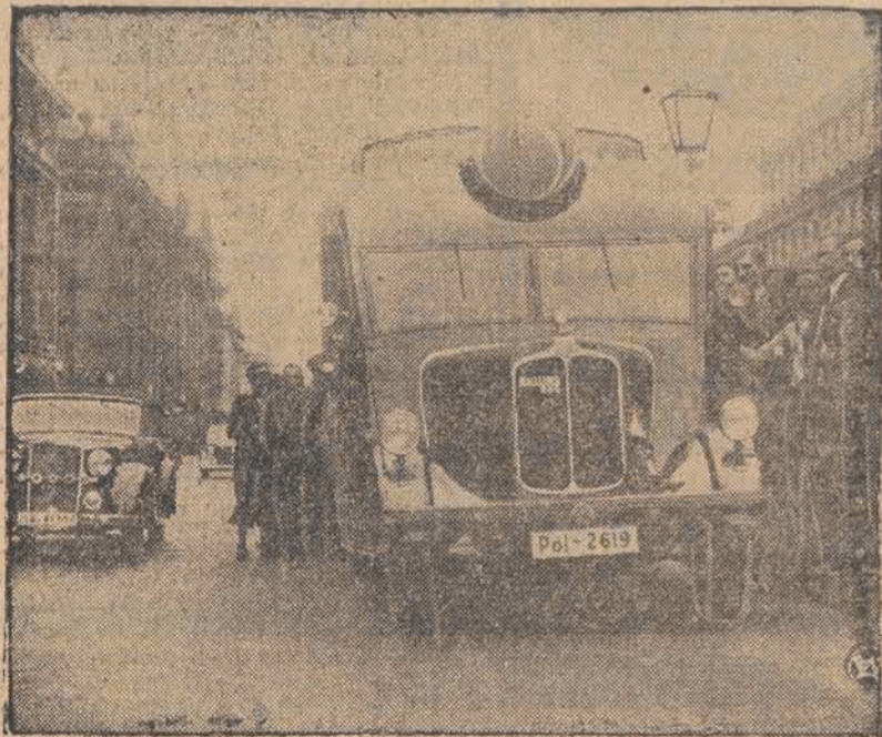
Policejka berlińska została wyposażona w specjalne auta z megafonami, przez które pełniący służbę policjanci wzywa samochody niestosujące się do przepisów drogowych do zatrzymania się i uiszczenia grzywny. Na zdjęciu — samochód policyjny z megafonem w czasie pełnienia „służby” na ulicach Berlina.