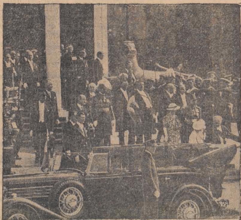
Brytyjska para królewska w chwili opuszczania dworca w Lasku Boulońskim.