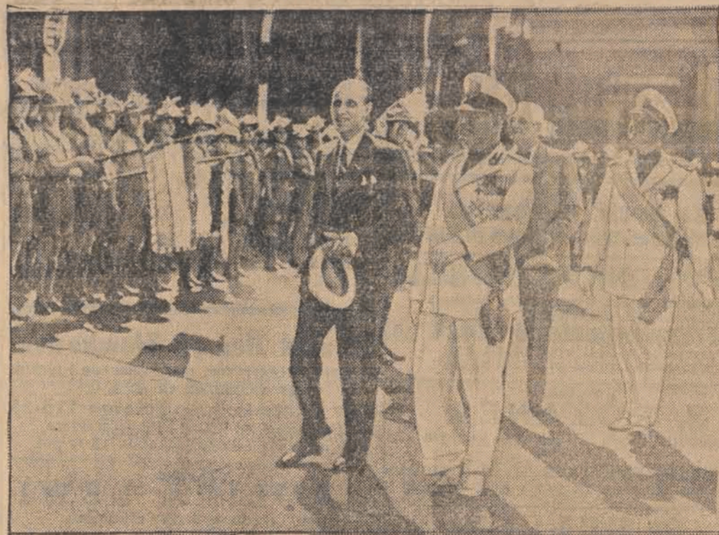
Mussolini przechodzi w towarzystwie węgierskiego premiera Imreiego przed frontem węgierskich harcerzy, którzy przybyli do Rzymu. Za nimi kroczą: węgierski minister spraw zagranicznych Kanya i minister hrabia Ciano.