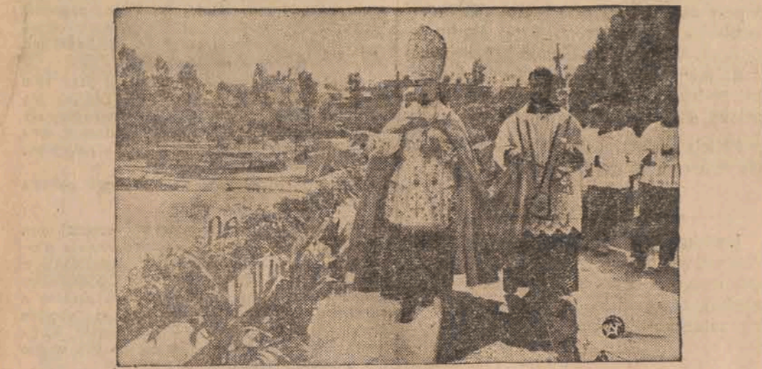
W Sofii odbyło się uroczyste poświęcenie kamienia węgielnego i założenie fundamentów pod budowę nowego gmachu Poselstwa Rzeczypospolitej w Sofii. Na zdjęciu: moment poświęcenia fundamentów pod budowę gmachu Poselstwa R.P. przez delegata apostolskiego na Bułgarię ks. arcybiskupa Guiseppe Mazzoli.