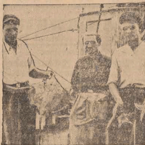
Rybaczy polscy na pokładzie kutra we Władysławowie, po powrocie z wyprawy na homary pod Skagen z ciekawą zdobyczą w postaci diabła morskiego, mątw, rozgwiazd i ośmiornic.