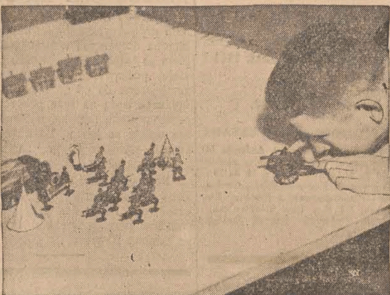
Nawet w dalekiej Australii panuje duch wojny. Najlepszym tego przykładem jest ten młodzieńcy wychowanek szkoły kadeckiej w Sydney, który z małej armatki strzela do miniaturowych żołnierzy.