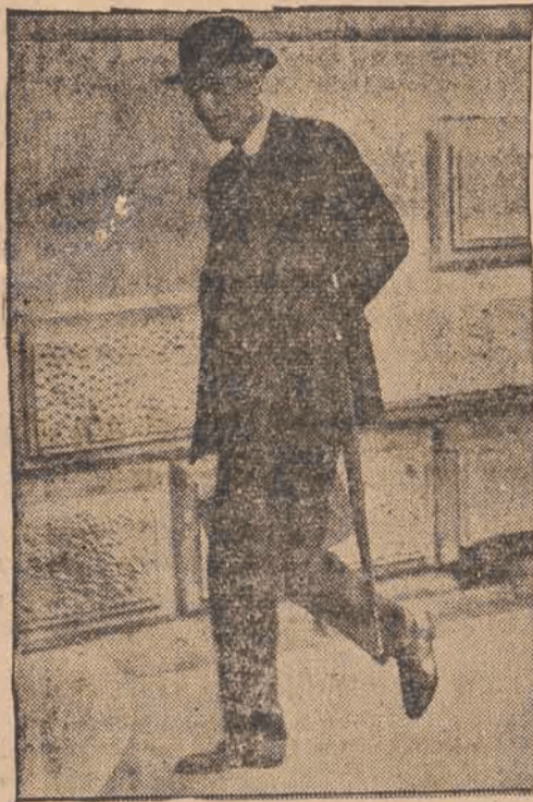
Minister spraw zagranicznych Wielkiej Brytanii lord Halifax powrócił do Londynu gdzie odbył konferencję z premierem w sprawie Czechosłowacji i Hiszpanii.