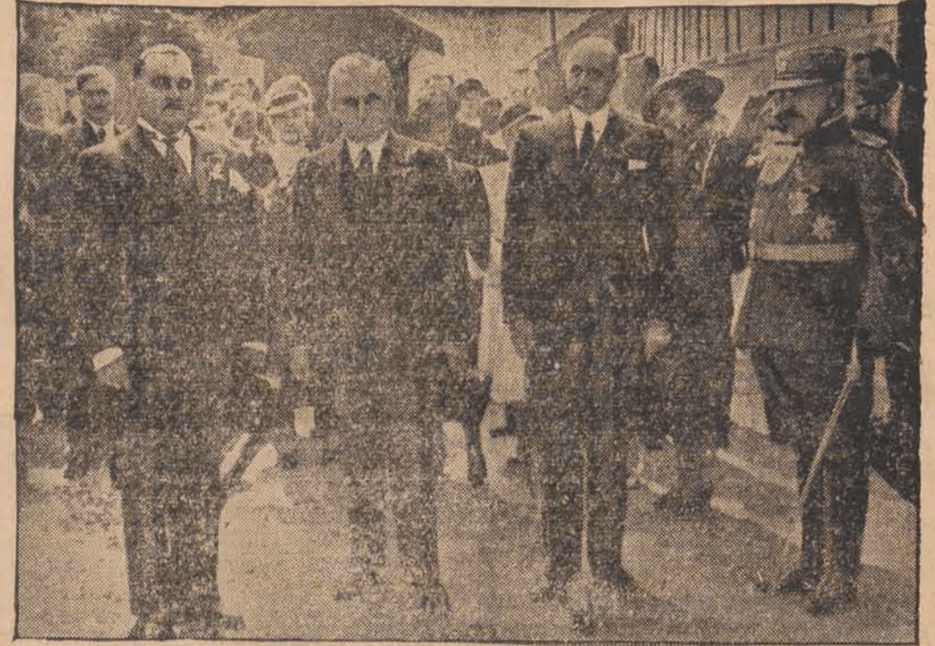
W Bled (Jugosławia) obradowali przedstawiciele Małej Ententy. Od lewej strony ku prawej stoją: Premier Jugosławii dr Stojadinowicz, czeskosłowacki minister spraw zagranicznych Krofta i rumuński minister spraw zagranicznych Petresku.