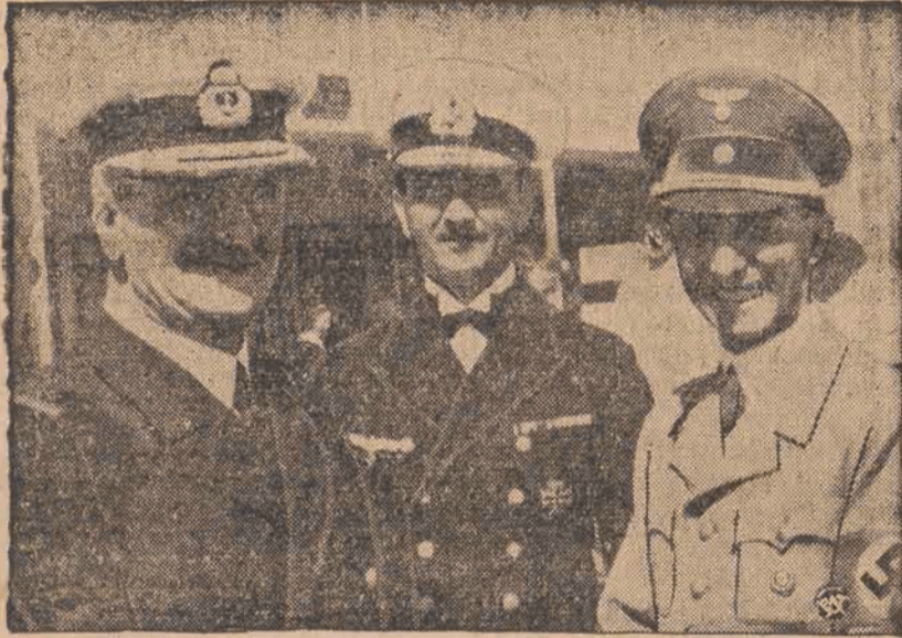
Regent Węgier admirał Horthy w towarzystwie ministra propagandy Rzeszy Goebbelsa i admirała Boehma na pokładzie niemieckiego okrętu „Patria“.