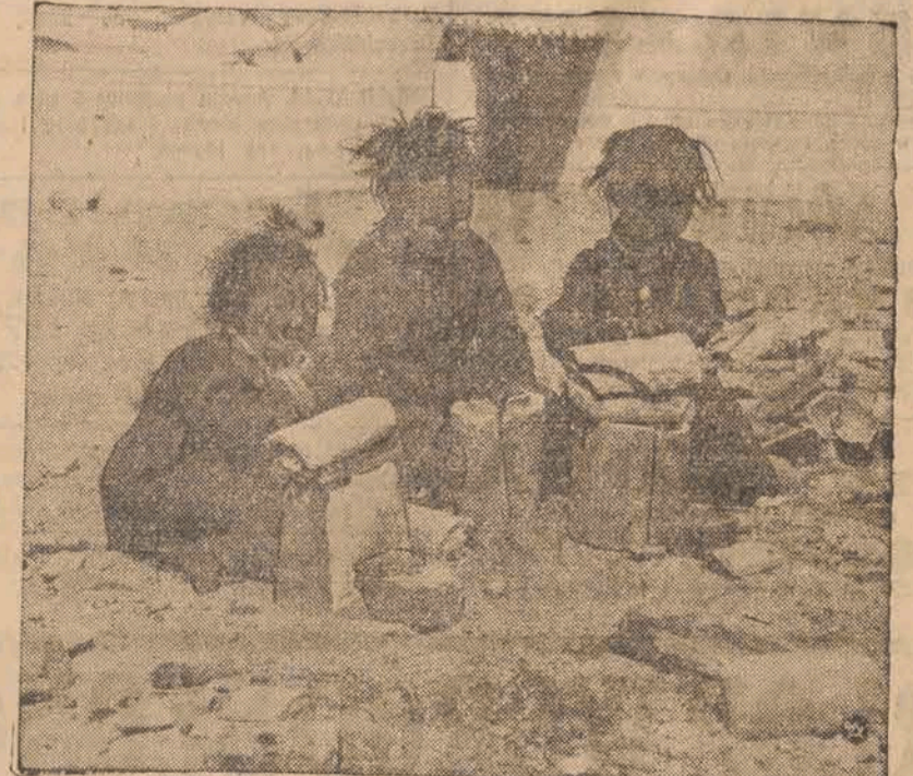
Zabawa dzieci mongolskich.