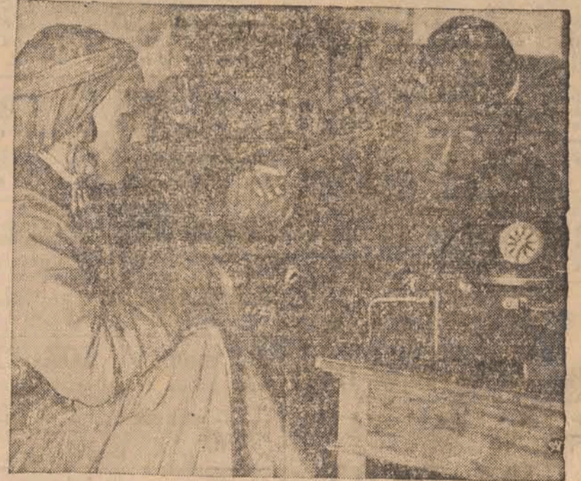
W związku z zawieruchą wojenną na Dalekim Wschodzie prasa europejska publikuje szereg artykułów związanych nie tylko z działaniami wojennymi, lecz również obyczajami i tradycjami Japończyków, Chińczyków, Mongołów i Mandżurów. Reprodukujemy dwa bardzo charakterystyczne zdjęcia ze Środkowej Mongolii. 1) Para Mongołów w zaciszu domowym przy patefonie.