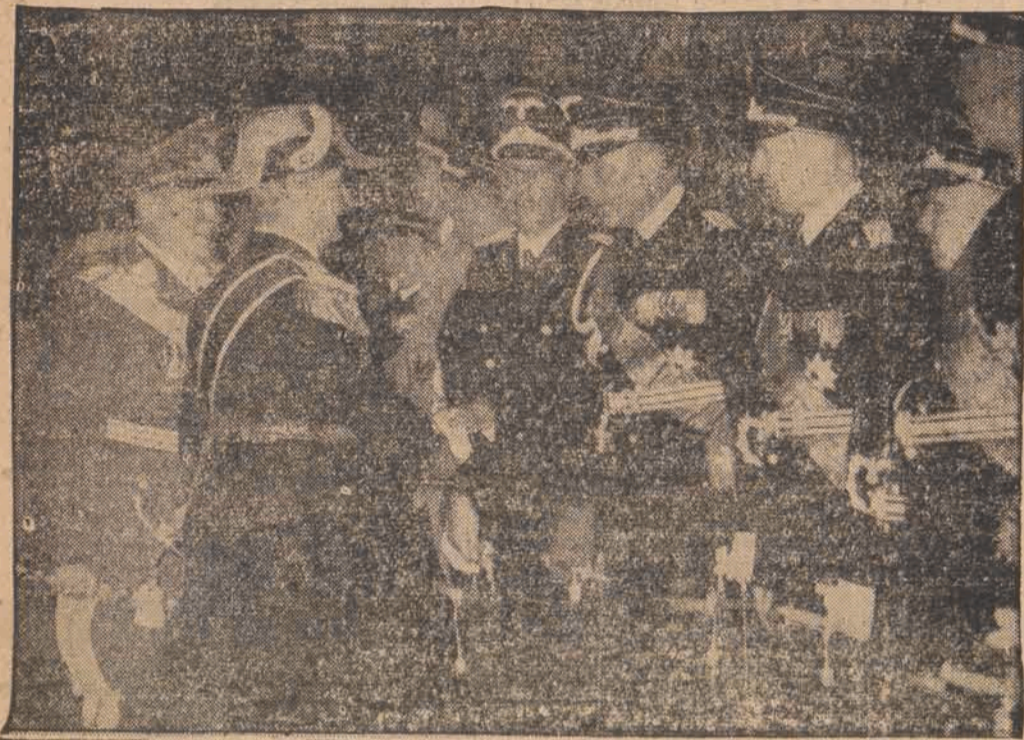
Regent Horthy wita się z przedstawicielami rządu i korpusu dyplomatycznego. Na lewo: premier Goering.