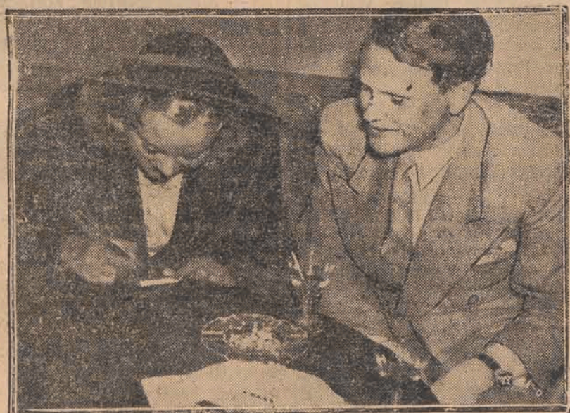
Znakomita artystka filmowa, b. łyżwiarska mistrzyni świata — Sonia Henie, podczas przyjęcia, wydanego na jej cześć przez szwedzkich producentów filmowych.