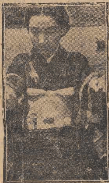
Japanka — artystka filmowa, pozująca do filmu, nakręcanego na jeziorze obok Tokio.