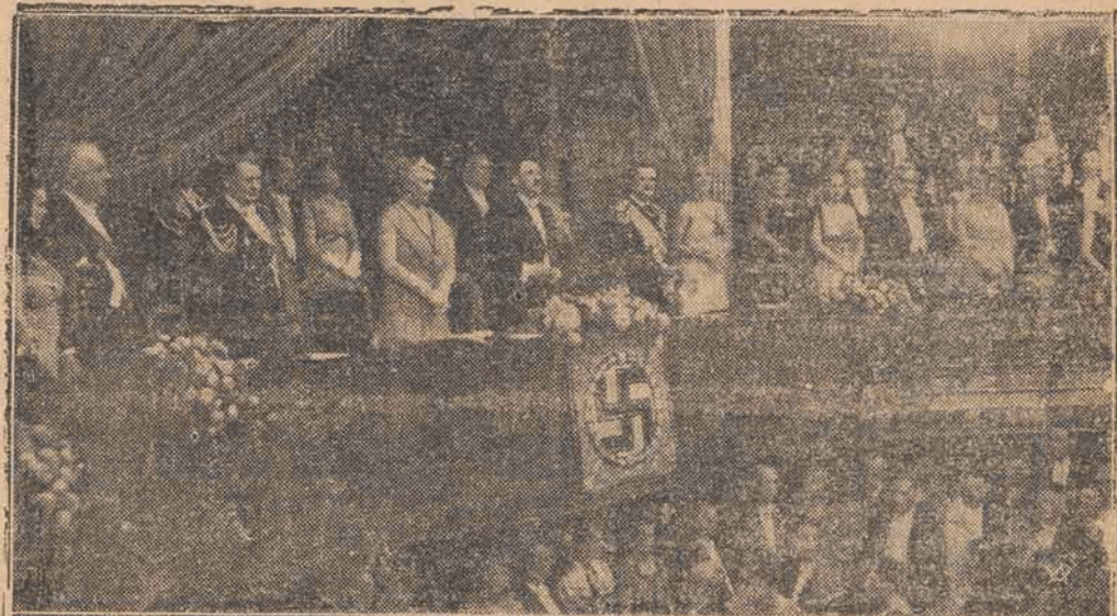
Moment z galowego przedstawienia „Lohengrina“ w Operze berlińskiej, na cześć regenta Węgier admirała Horthy'ego. W loży honorowej widzimy regenta Horthy'ego z małżonką, kanclerza Hitlera oraz marszałka Goeringa z małżonką po odegraniu hymnów narodowych węgierskiego i niemieckiego. (Regent Horthy wraca do Budapesztu na pokładzie statku dunajowego, musiał pod Wiedniem przerwać podróż z powodu wysokiego stanu wody.)

Zapytany, co sądzi o ewentualnej mediacji, gen. Franco odpowiedział, że ci, którzy życzą sobie mediacji, służą ukrytym wrogom Hiszpanii. „Hiszpania narodowa zwyciężyła i nie pozwoli sobie odebrać ani też zmniejszyć zwycięstwa w niczym i przez nikogo”.