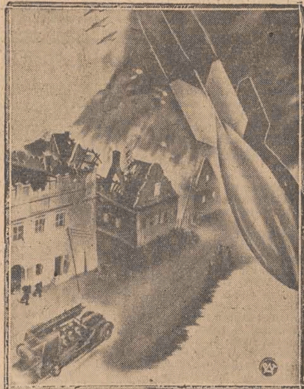
W związku z rozpoczynającym się 4.9. Tygodniem Obrony Przeciwpozarowej, reprodukcją dla celów propagandowych, wydany przez Zarząd Główny Związku Straży Pożarnych.