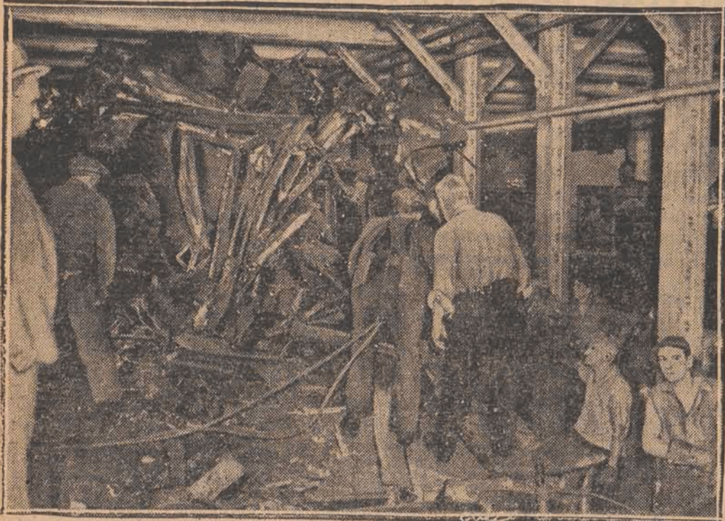
W Nowym Jorku zderzyły się dwa pociągi kolei podziemnej, przy czym kilka osób zostało zabitych a przeszło 50 odniosło ciężkie obrażenia.