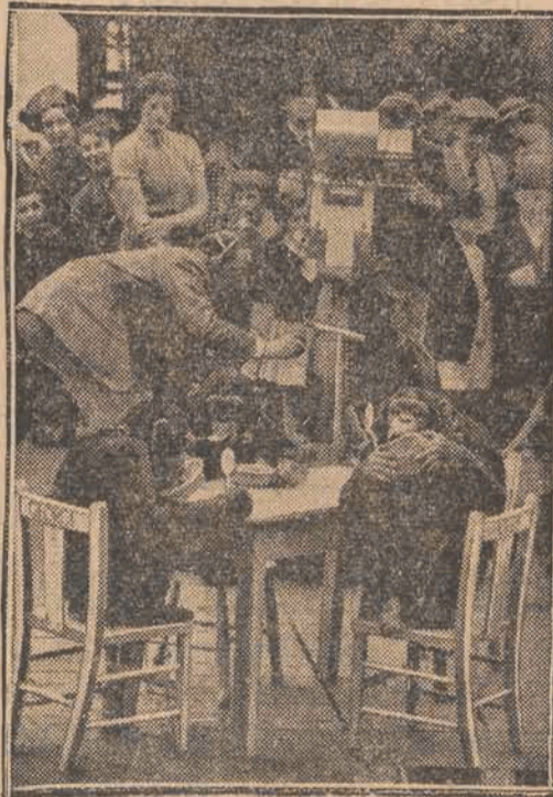
W londyńskim ogrodzie zoologicznym urządzono „herbatkę szympansov“, którą przekazano za pomocą aparatu telewizyjnego abonantom radia.