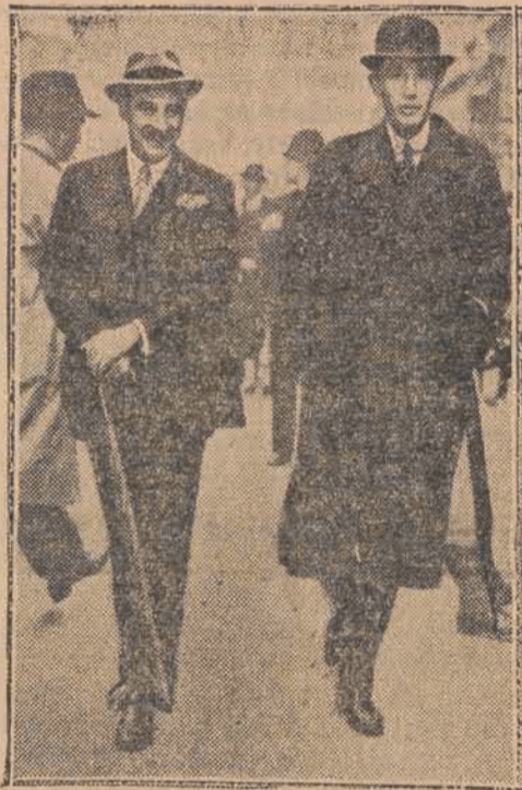
Sir Neville Henderson angielski ambasador w Berlinie (na lewo) oraz angielski min. Spraw Zagr. lord Halifax opuszczają po konferencji gmach ministerstwa przy ul. Downing Street 10.