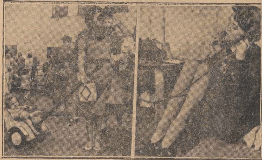
Na wystawie w Londynie pokazano dwa przydatne udogodnienia życiowe: 1) Wózek dla najmłodszego dziecka, 2) Tele fon z lusterkiem i notatnikiem.