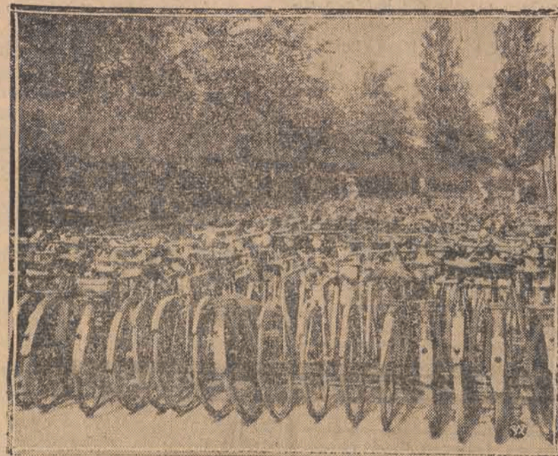
Nieliczone rowery, biorące udział w kolarskich mistrzostwach świata w Amsterdamie, w prowizorycznym garażu.