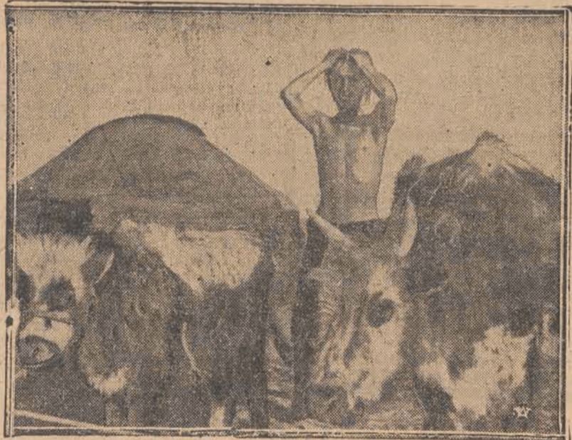
1) Młodzież japońska w Instytucie Technicznym w Tokio, już od wczesnych lat poznaje tajniki wiedzy technicznej, którą kiedyś obróci na dalszą modernizację swego kraju. 2) — typowy obrazek wypasu trzody na rozległych stepach mongolskich.