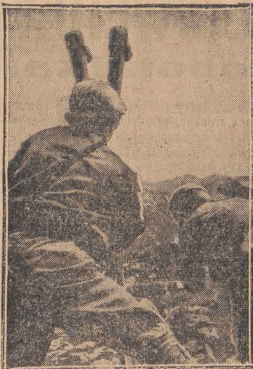
Oficer wojsk powstańczych obserwuje skuteczność ognia artyleryjskiego swej baterii w okopach nieprzyjacielskich.