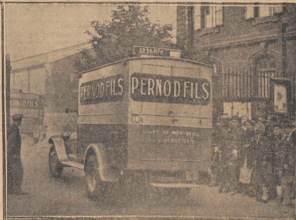
Władze we Francji zarządziły przegląd prywatnych samochodów, celem skłasyfikowania ich stanu i używalności. Na zdjęciu: samochody firmowe w Paryżu w drodze do warsztatów.