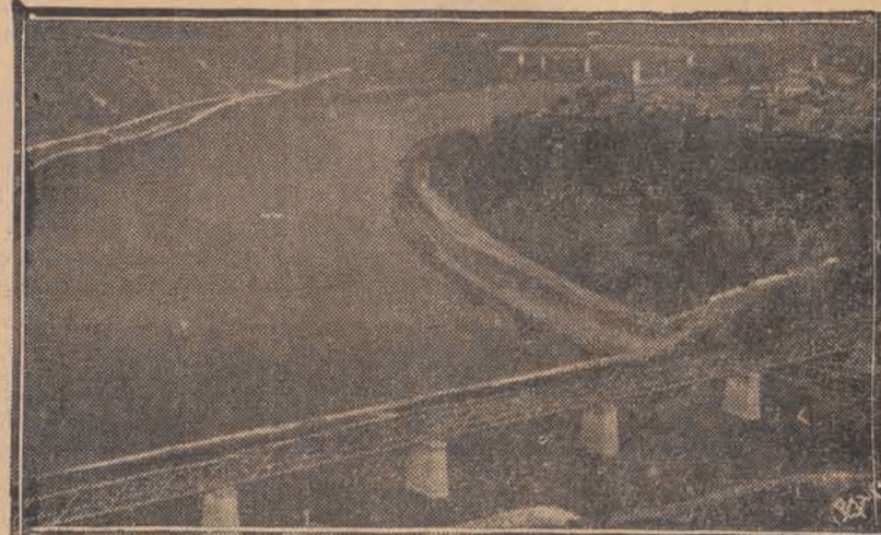
Na Dniestrze pod Zaleszczykami odbyło się uroczyste otwarcie nowego mostu drogowego, łączącego terytorium Rzeczypospolitej Polskiej z Rumunią. Na zdjęciu: rzut oka na nowootwarty most wraz z piękną panoramą Zaleszczyk.