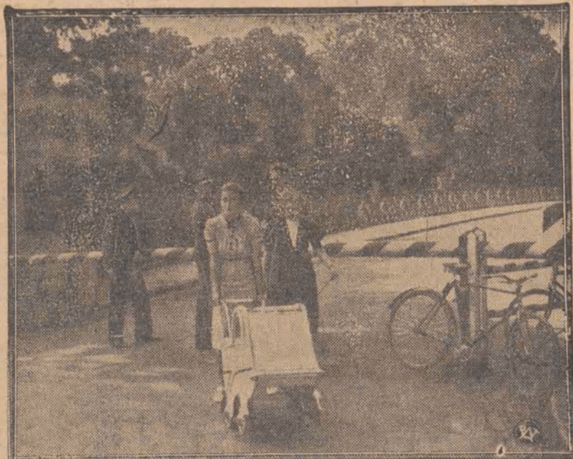
Jedna z codziennych scen na granicy polsko-czeskiej w Cieszynie. Oto matka wraz z małym dzieckiem, która kilka razy dziennie przekracza most graniczny, mając nadzieję za Olzą. Fakt ten świadczy niezbicie o tym, jak żywcem został rozdarty Cieszyn przez Czechów.