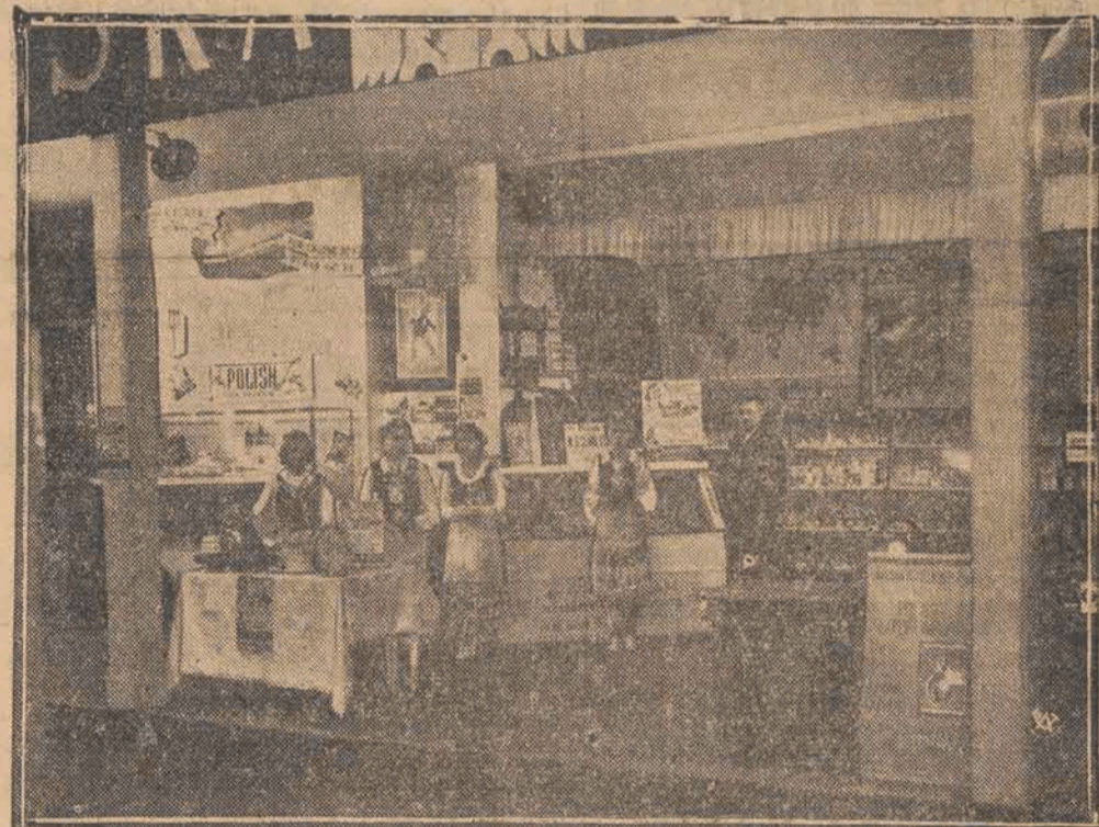
Państwowy Instytut Eksportowy zorganizował zbiorowy udział handlu i przemysłu polskiego w Kanadyjskiej Wystawie Narodowej w Toronto. Stoisko polskie wzbudziło żywe zainteresowanie kupiectwa kanadyjskiego, które miało możliwość zapoznania się z produkcją prawie 100 najpoważniejszych polskich firm eksportowych. Należy podkreślić, że stoisko polskie było urządzone bardzo celowo i estetycznie. Nawiązanie nowych kontaktów handlowych z bardzo chłonnym rynkiem kanadyjskim, będzie miało niewątpliwie duże znaczenie dla przyszłości polskiego eksportu, prócz poważnych ogólnych celów propagandowych. Na zdjęciu — fragment stoiska polskiego na Narodowej Wystawie Kanadyjskiej w Toronto.