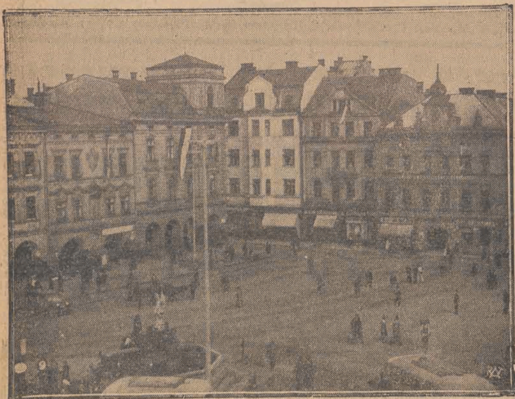
Rzut oka na rynek w polskim Cieszynie.