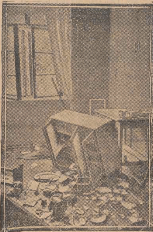
W Unterretzbach (Sudety) doszło do walki między Niemcami sudeckimi a czeskimi celnikami, w czasie której urząd celny został zdemolowany.