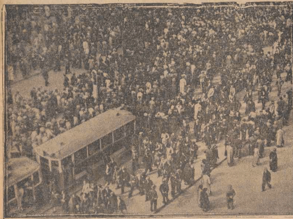
Tłum na ulicach Pragi słucha przemówienia przez megafon.