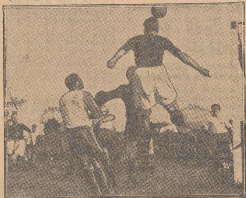
Fragment z międzynarodowego meczu piłki nożnej, rozegranego w Rydze, między reprezentacjami Polski i Łotwy, która zwyciężyła z wynikiem 2:1.