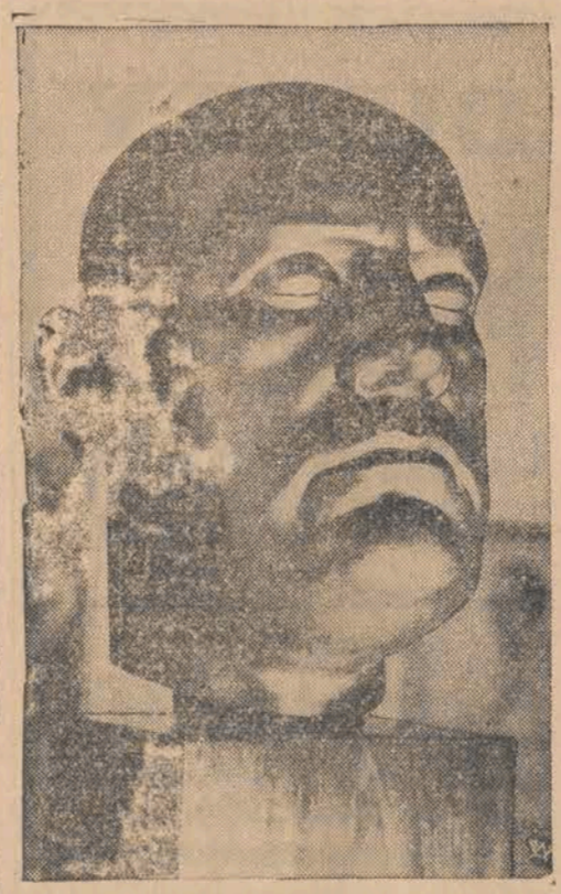
W Pałacu Sztuki w Berlinie została otwarta trzecia ogólnoniemiecka wystawa sztuki. Na zdjęciu — brązowe popiersie Mussoliniego, dzieło Adama Antesa z Darmstadt.