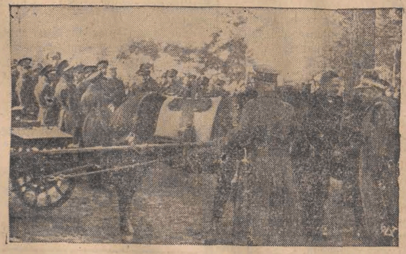
Uroczysty moment przekazania gen. Kruszewskiemu karabinu maszynowego, ufundowanego przez ludność dla KOP.