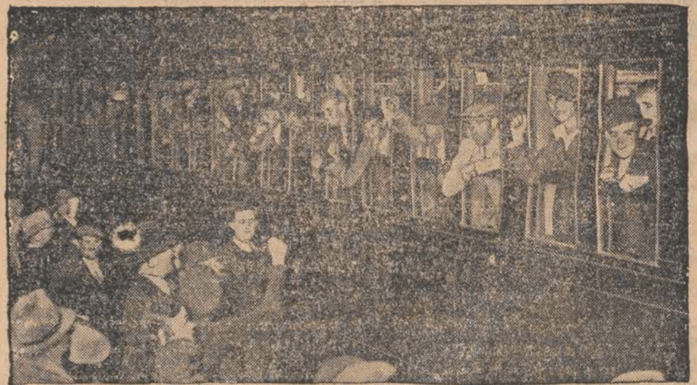
Do Paryża wróciło 352 Francuzów-inwalidów, którzy walczyli jako ochotnicy w hiszpańskich wojskach rządowych.