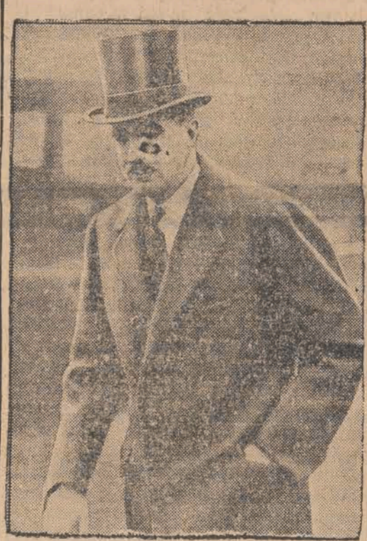
Wskutek uderzenia odnowiła się ministrowi dominiów Wielkiej Brytanii lordowi Stanleyowi rana, odniesiona w czasie wojny i wywiązało się zakażenie krwi, zakończone śmiercią.