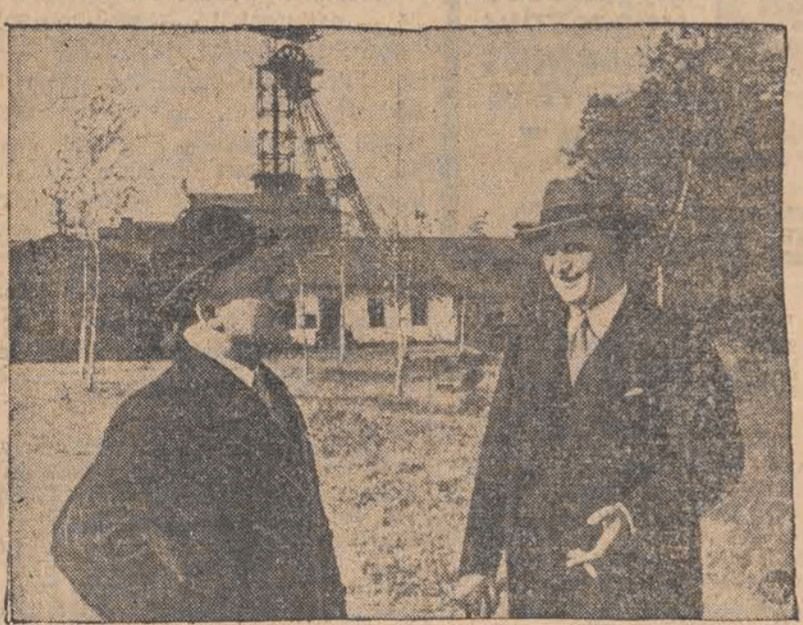
Minister Roman i minister Ulrych, podczas pobytu na Zaolziu.