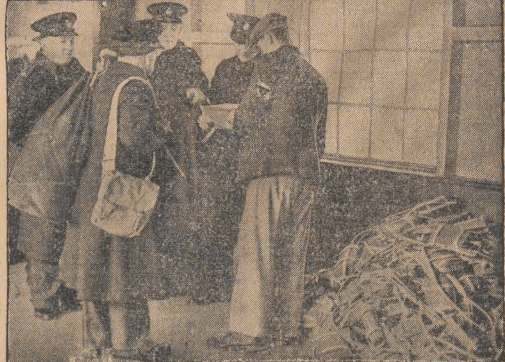
Wobec zaniechania plebiscytu w okręgach sudeckich Czechosłowacji Legion Brytyjski, który już był zarejestrowany na stacjach transportowych, został po kilku dniach czekania w porcie, obecnie zdemobilizowany.