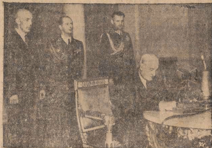
Na zdjęciu — Prezydent Rzeczypospolitej w chwili wygłaszania przemówienia radiowego do Ameryki.