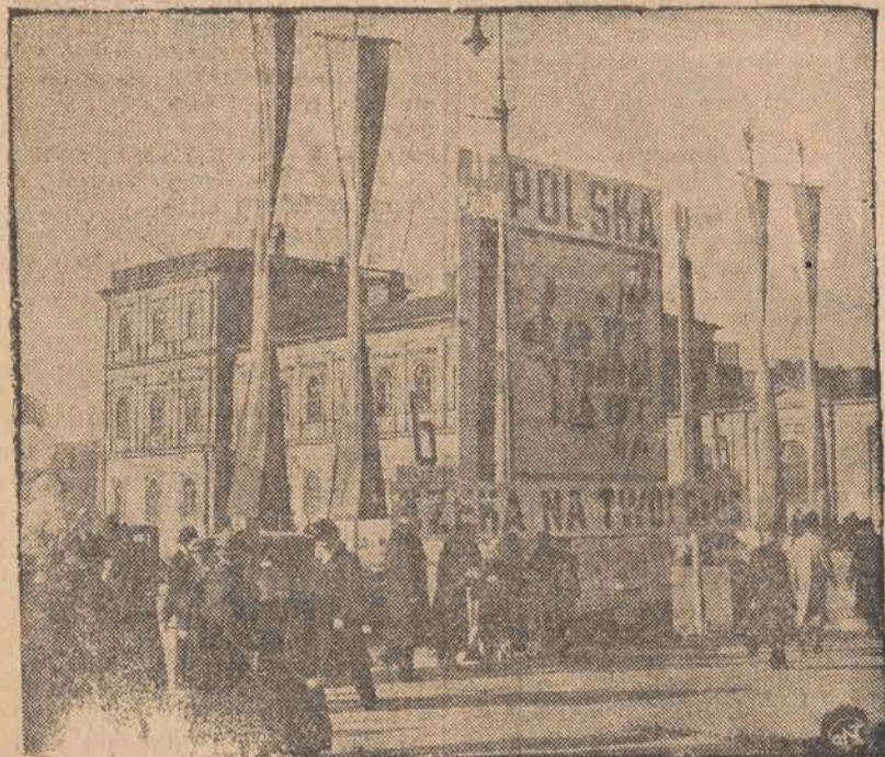
Kampania wyborcza na Alejach Jerozolimskich. Wyborcze transparenty.