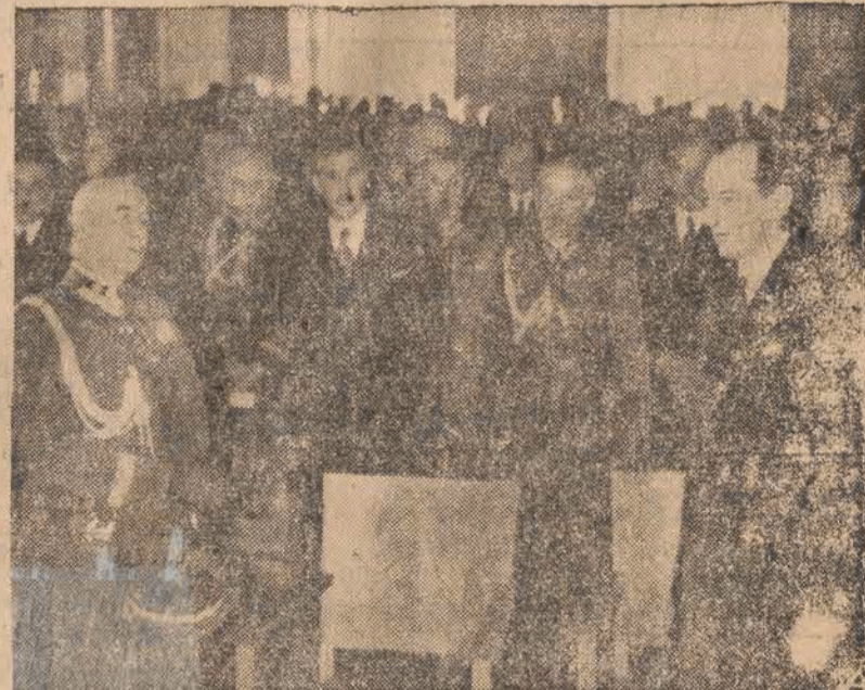
Marszałek Śmigły - Rydz dziękuje senatowi Uniwersytetu Józefa Piłsudskiego za przyznanie mu godności.