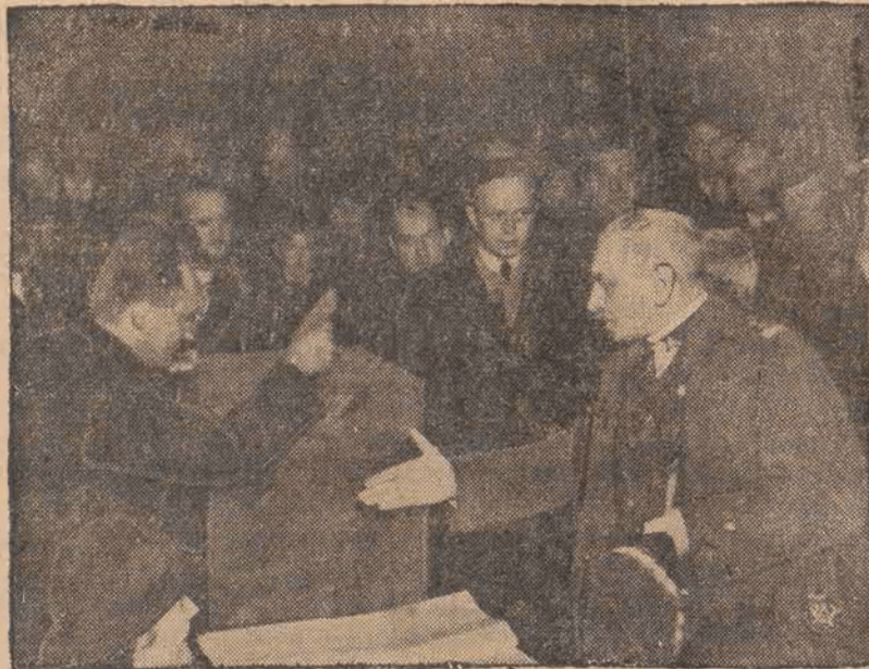
Moment głosowania Premiera gen. Sławoja Składkowskiego.