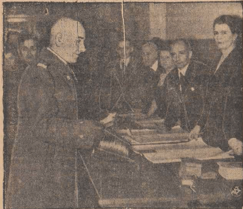
Naczelnny Wódz Marszałek Śmigły - Rydz przy urnie wyborczej.

Odbyły się wybory do nowego Sejmu Rzeczypospolitej. Wysoka frekwencja głosujących, dochodząca w niektórych częściach kraju do 90 proc., a przeciętnie około 70 proc., świadczy o dużym zrozumieniu i poczuciu obywatelskim Narodu w obliczu ważnych rozstrzygnięć dla przyszłości Państwa. W całym kraju zostali wybrani przeważnie kandydaci Obozu Zjednoczenia Narodowego.