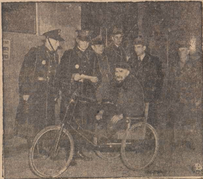
Bez nogi inwalida przyjechał do lokalu wyborczego celem oddania głosu.