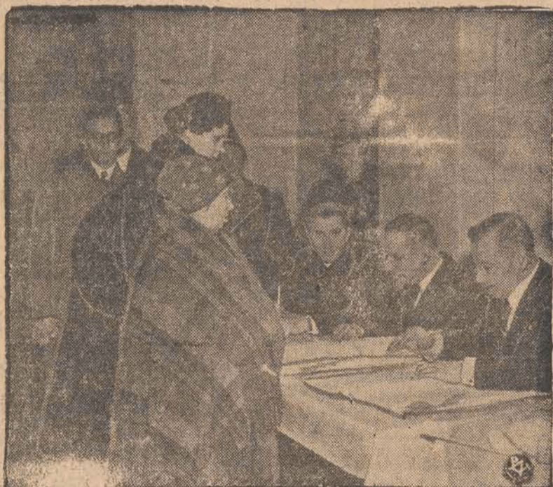
Typowa scena z głosowania.