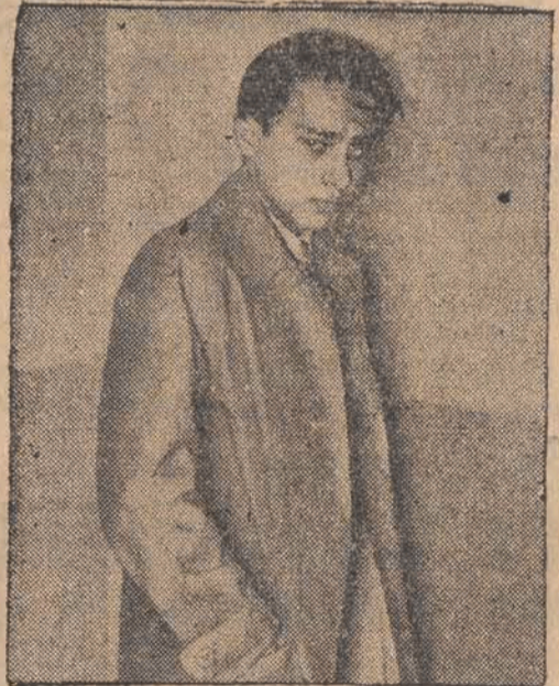
Herszel Seibel Grynspan, który dokonał rewolwerowego zamachu na sekretarza ambasady niemieckiej w Paryżu.