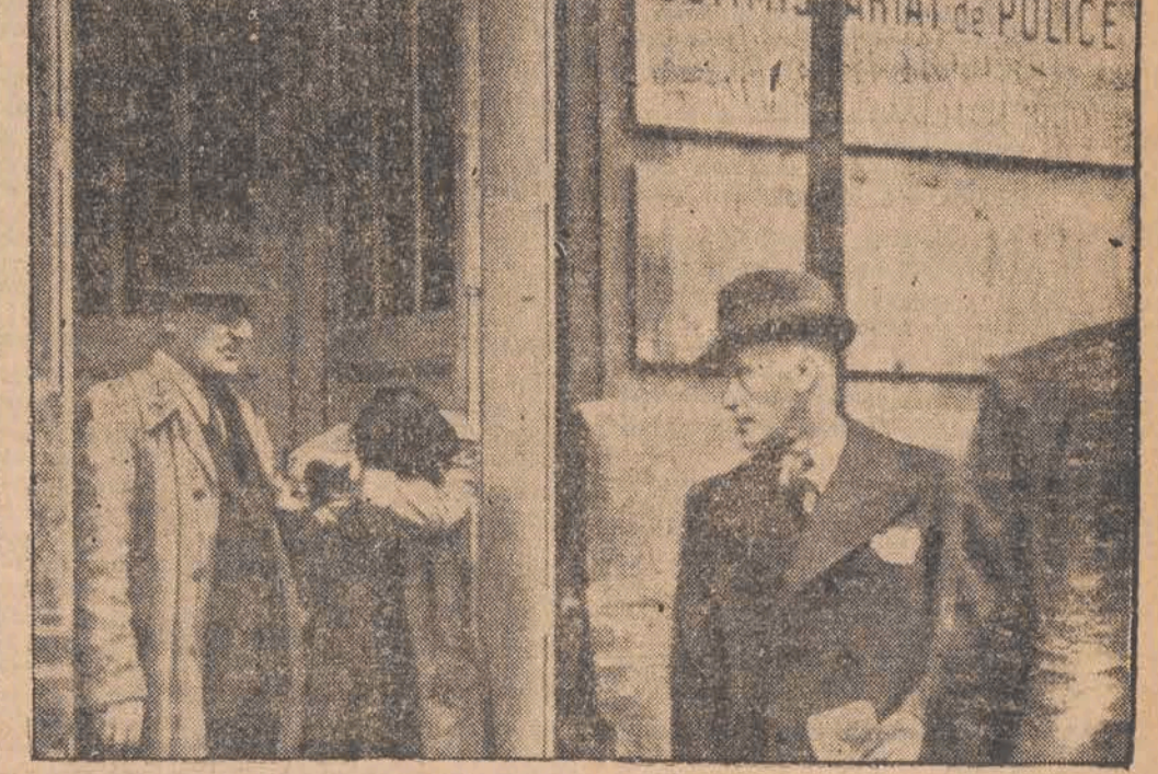
Aresztowany Herszel Grynspan zasłania swą twarz podczas wprowadzania go do komisariatu policji.