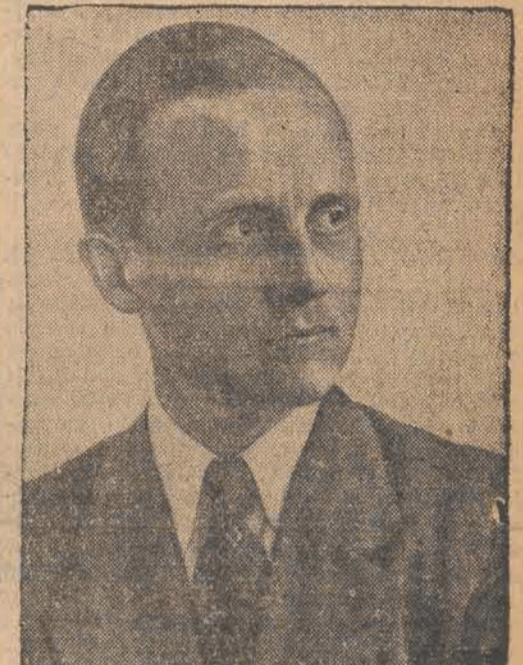
Sekretarz ambasady niemieckiej w Paryżu von Rath, pomimo wysiłków lekarzy zmarł wczoraj w klinice paryskiej.