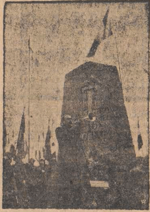
Pomnik w Haudroy, wzniesiony przez b. francuskich żołnierzy frontowych, dla upamiętnienia 20-ej rocznicy zwycięstwa.