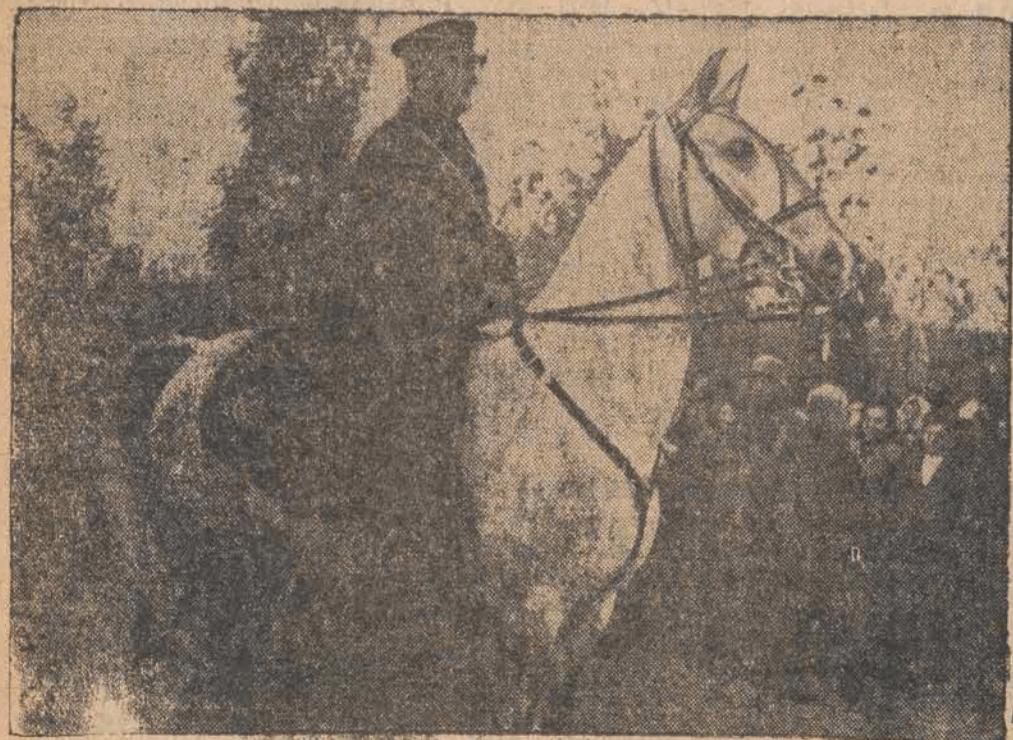
Regent Horthy przyjmuje salutę w oddzielnym przez Węgrów Komornie.