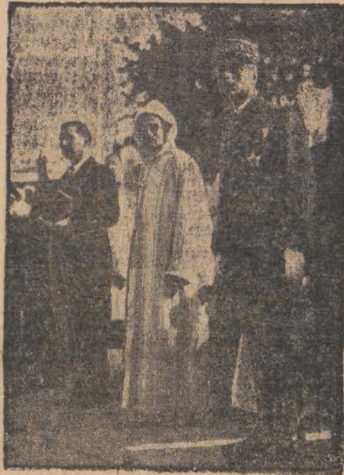
Francuski minister lotnictwa Guy la Chambre, Sultan Marokka i generalny rezydent gen. Nogués, podczas uroczystości odsłonięcia pomnika Marszałka Lyautey'a w Casablance.