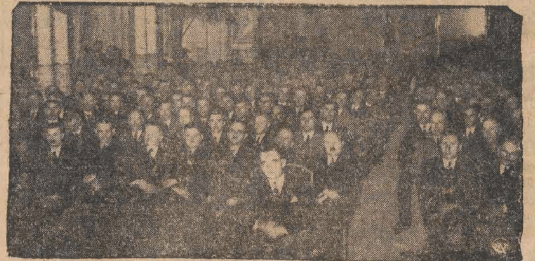
Wczoraj odbył się w sali kolumnowej Rady Miejskiej w obecności wiceministra Spraw Wewnętrznych Korsaka, ogólnopolski zjazd wójtów, zwołany przez sekcję wójtów przy Związku Gmin Wiejskich. W zjeździe bierze udział delegacja wójtów ze Śląska Zaolzańskiego. Na zdjęciu — rzut oka na plenarne obrady wójtów. W pierwszym rzędzie siedzi wiceminister Korsak.