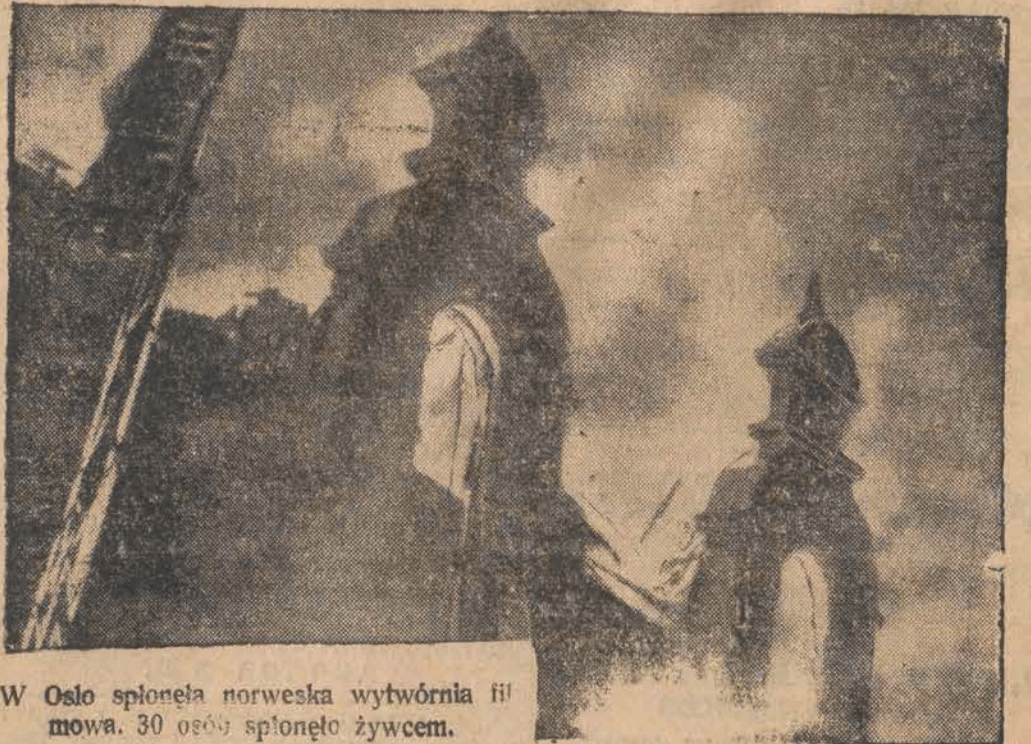
W Oslo spłonęła norweska wytwórnia fil mowa. 30 osób spłonęło żywcem.