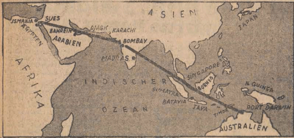
Jak donosiliśmy, przelaty 3 angielskie bombowce z Egiptu do Australii bez lądowania. Na mapie trasa lotu.