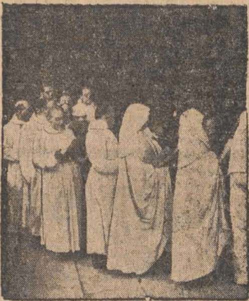
W kościele de la Sainte Chapelle w Paryżu, została wznowiona tradycja panująca między XII a XVIII-ym wiekiem odprawiania raz do roku specjalnie uroczystej Mszy świętej, zwanej Mszą Ubogich. Na zdjęciu fragment procesji szarytek podczas Mszy św. dla ubogich.