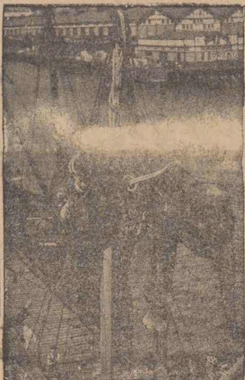
Na zdjęciu — ofiarzył słoń, podczas wyładowywania go z okrętu na ląd stały, dla umieszczenia w Zoo.