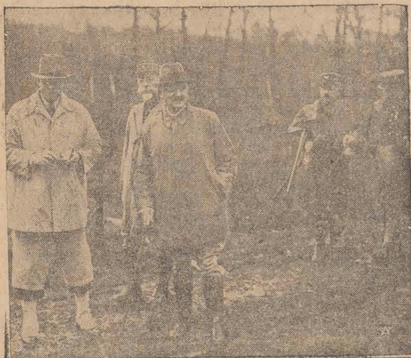
Zdjęciu — król Karol rumuński i Prezydent Francji Lebrun, na polowaniu reprezentacyjnym, wydanym na cześć królewskich gości rumuńskich w Rambouillet.