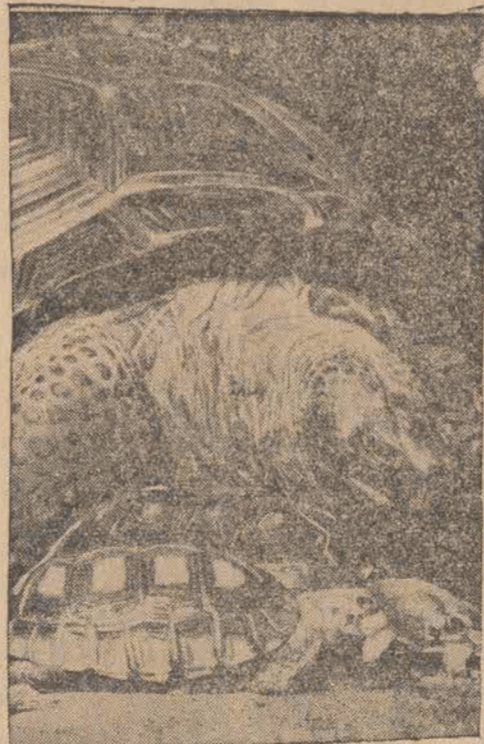
Stary żółw ze smętkiem konstatuje, że starość musi ustąpić przed młodością, przynajmniej w wyścigu do... miski. Młody żółw brazylijski w londyńskim ogrodzie zoologicznym pochwyty z miski smakowały keś, zaim stary żółw zdoleł się przyczłochać.