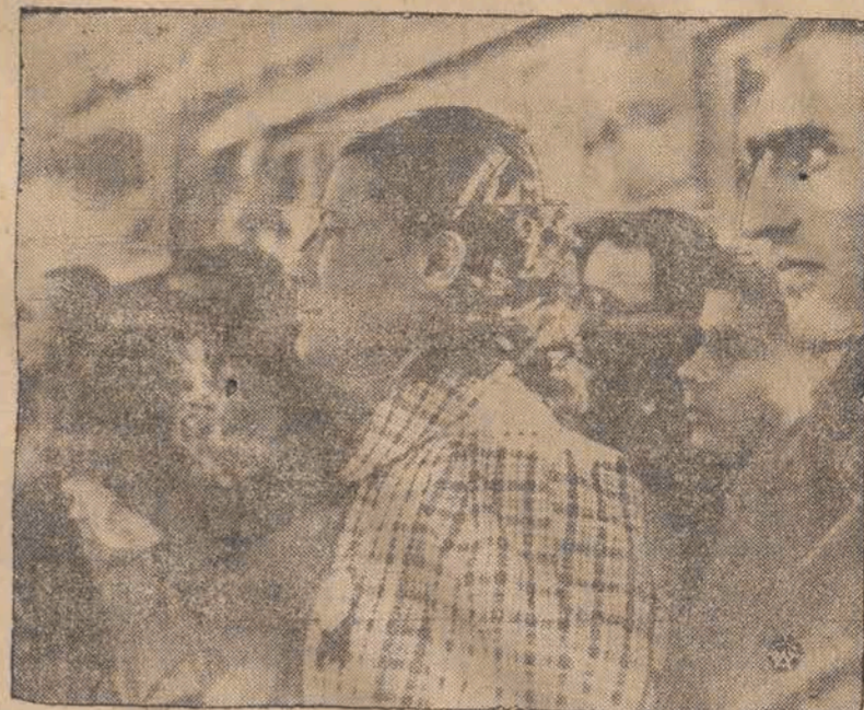
Na zdjęciu: Luźność stolicy Turcji z placem żegna swego prezydenta i wielkiego reformatora. (Zdjęcie dostarczone pocztą lotniczą do Bukaresztu, zaś z Bukaresztu telegraficznie).