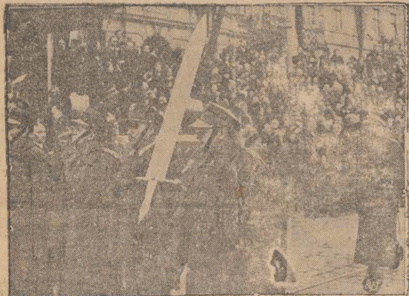
Frag. nt z defilady b. Obrońców Lwowa z symbolicznym mieczem, za którym postępuje jeden z dowódców obrony Lwowa gen. Karaszewicz-Tokarzewski.