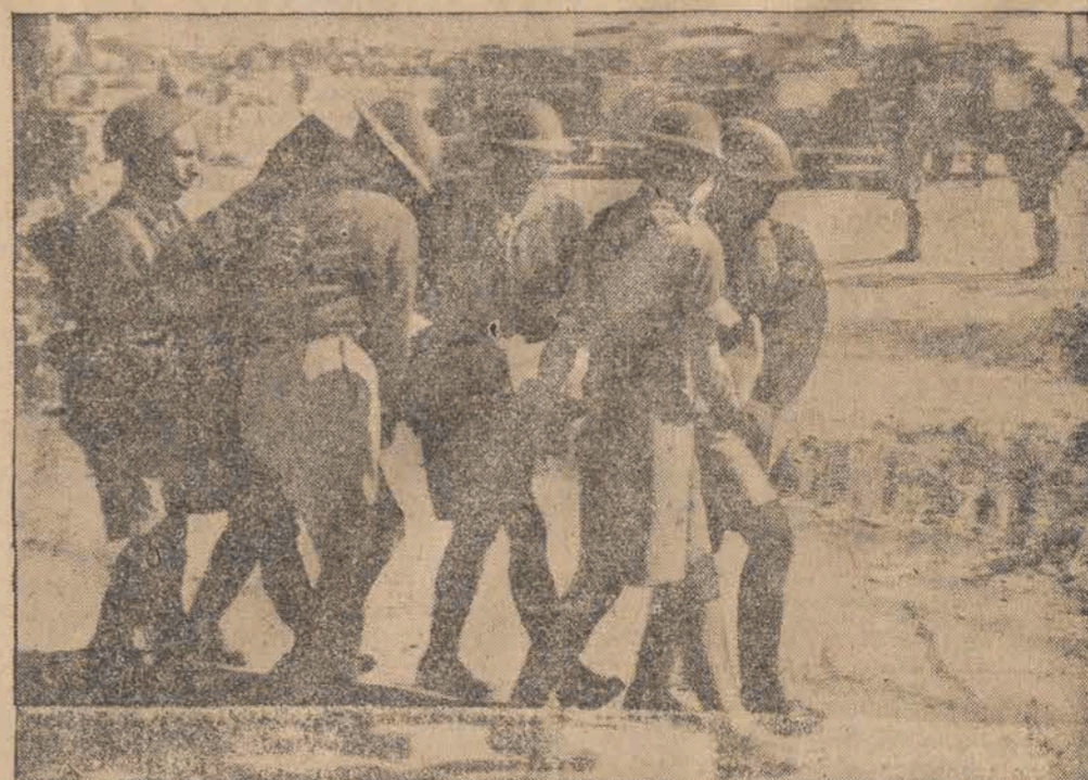
Po zdobyciu Ierwcha przez Anglików, sanitariusze odwożą rannych do szpitala.