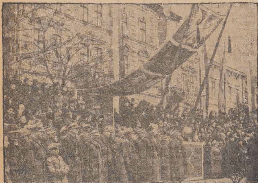
Rzut oka na trybunę reprezentacyjną podczas defilady lwowskiej.

W uroczystościach, związanych z XX-ą rocznicą bohaterskiej obrony Lwowa, jakie odbyły się w ciągu ostatnich dwóch dni w grodzie Orłąt Lwowskich, wziął udział minister spraw wojskowych gen. Kasprzycki, który na zakończenie uroczystości w dniu 22-go bm. przyjął defiladę b. Obrońców Lwowa, oraz oddziałów miejscowego garnizonu.