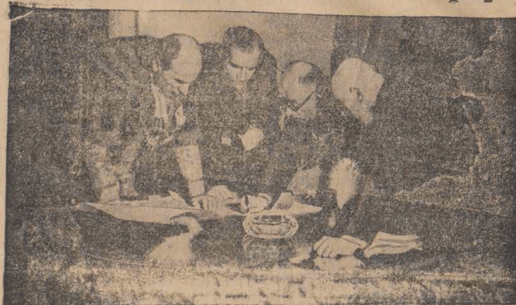
Premier Imredy i nowi ministrowie Jaros, Telky i Keresztes-Fischer studują mapę północnych Węgier.