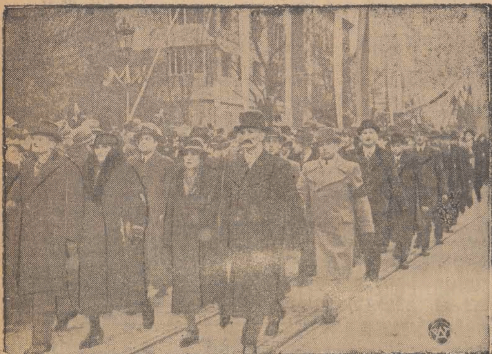
Obroncy Lwowa — z Góry Straceń — w defiladzie.

Rodzice chrzestni jednego ze sztandarów, ufundowanych dla pułków lwowskich w XX-ą rocznicę obrony Lwowa, wręczają go ministrowi spraw wojskowych gen. Kasprzyckiemu.