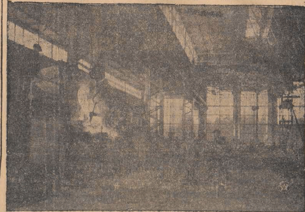
Stalowa Wola — moment odlewu stali w hucie.

Wskutek zajęć w Jerozolimie wszyscy zagraniczni turyści opuścili miasto. Pozostała tylko jedna Amerykanka, którą widzimy na zdjęciu w chwili, gdy policjant angielski bada jej paszport. Odważna turystka używa arabskiego zawoju głowy.