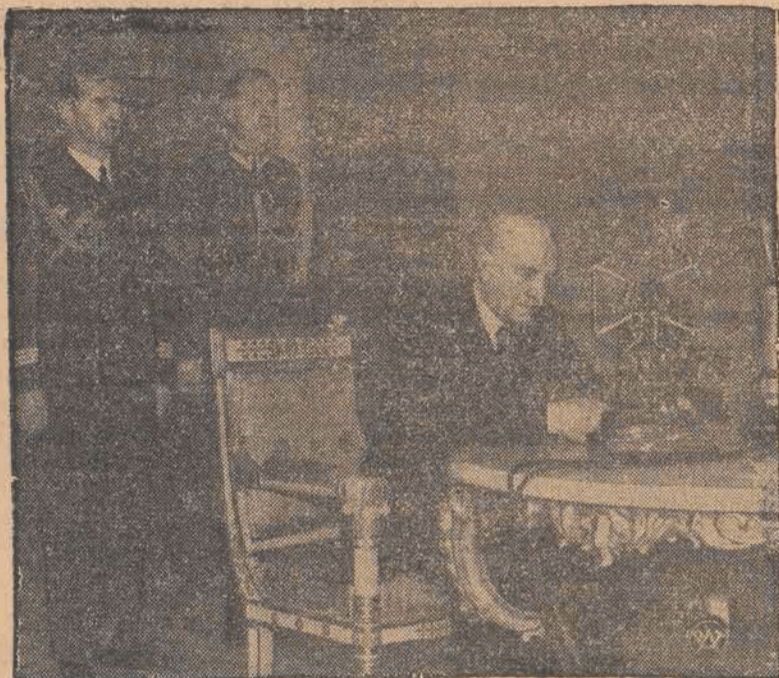
Moment przemówienia radiowego P. Prezydenta Rzeczypospolitej.