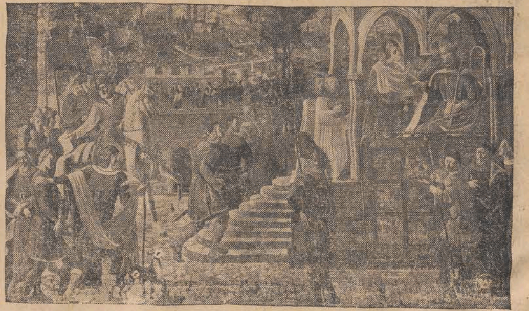
Chrzest Litwy Rok 1386