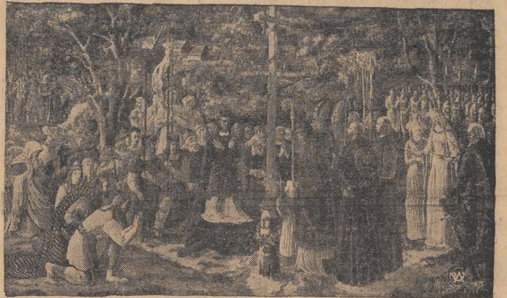
Nadanie przywileju zwanego Jedlińskim (Neminem captivabimus). Rok 1430.