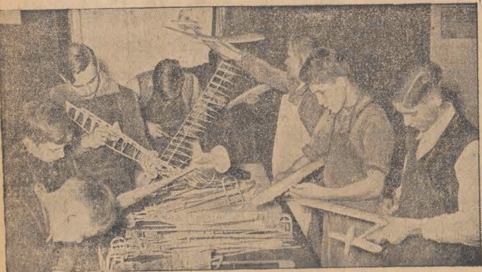
Młodzież szkolna z zapalem konstruuje modele latające pod opieką swych nauczycieli