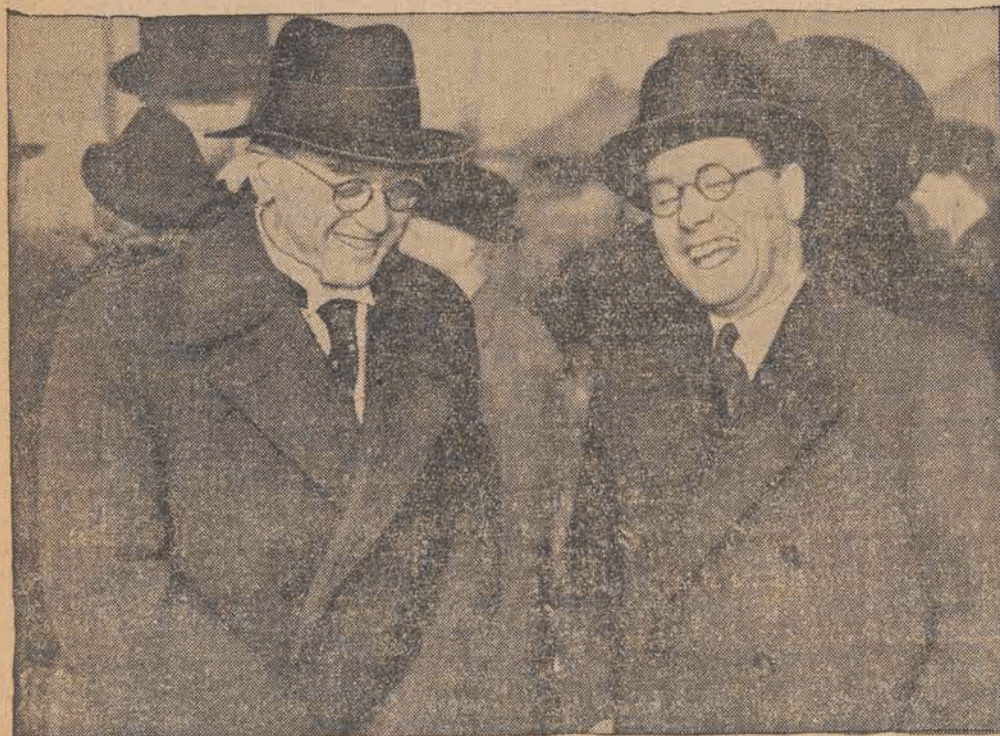
Min. Unii Południowo-Afrykańskiej Pirow odjechał po zwiedzeniu Anglii, Niemiec, Francji, Włoch i Belgii z powrotem do Kapsztadu. Na zdjęciu: Pirow (na lewo) tuż przed odjazdem z dworca londyńskiego prowadzi wesołą rozmowę z min. kolonii Malcolmem Macdonaldem (na prawo).