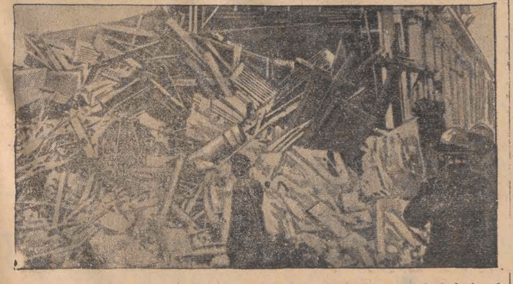
Zwalisła teatru miejskiego w m. Concepcion, gdzie 400 widzów znalazło śmierć pod gruzami.