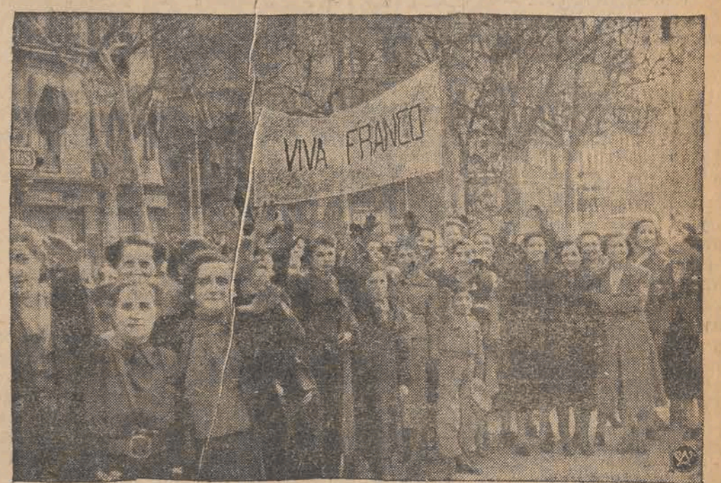
Manifestacja młodzieży barcelońskiej na cześć gen. Franco, w Alei „Paseo de Gracia” w Barcelonie.