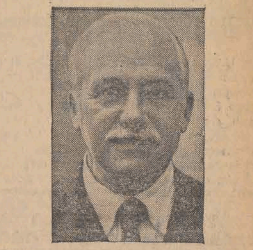
SIR HENRY DETERDING zmarł przeżywszy lat 72.