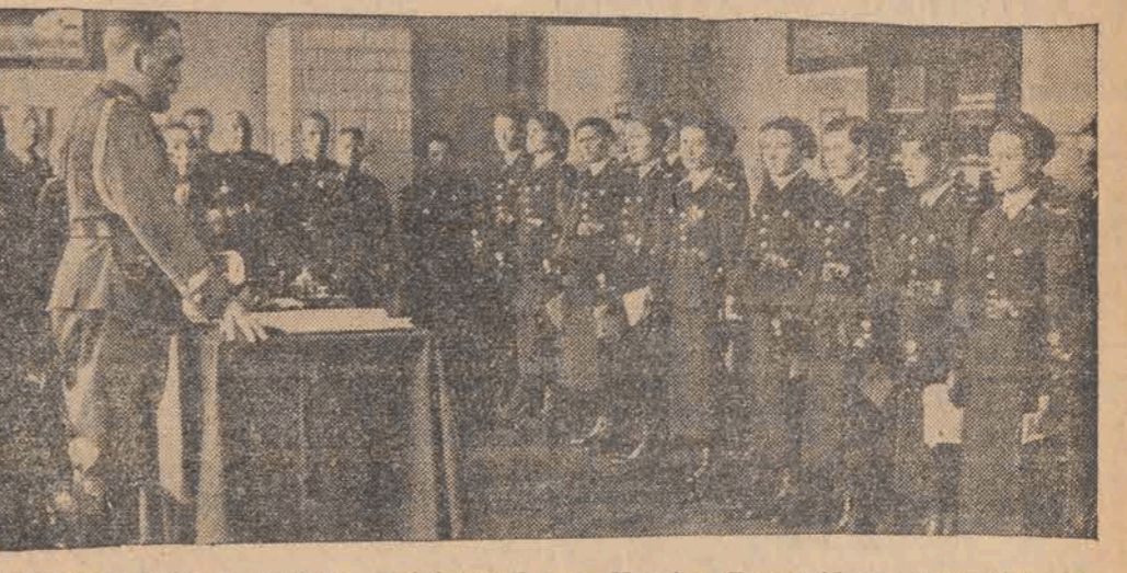
Komendant Główny Policji Państwowej gen. Kordian Zamorski na uroczystym zakończeniu kursu dla kobiet — szeregowych policji, który odbywał się w Szkole Oficerów Policji.