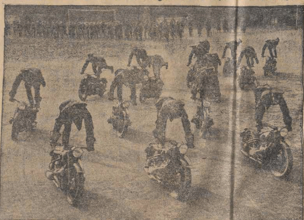
Berlińska policja trenuje celem przygotowania się do popisów sportowych w dniu 9 lutego.