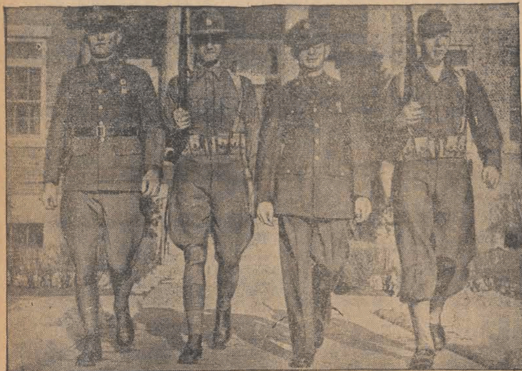
Na lewo: dotychczasowy mundur świąteczny i ćwiczebny; na prawo: nowy mundur świąteczny (długie spodnie) oraz nowy mundur ćwiczebny (miękką czapka zamiast kapelusza harcerek).