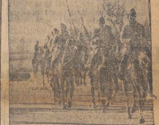
Francuscy dragoni w drodze na pogranicze katalońskie, gdzie ludność została zagrożona przez waleśjące się oddziały nieszypliowanych maruderów, przechodzących przez granicę poza punktami urzędowymi.