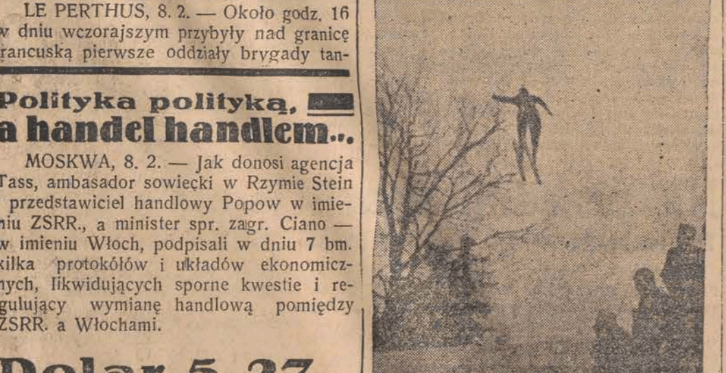
Efektowny skok w czasie generalnej próby naszych zawodników przed zawodami F. I. S.