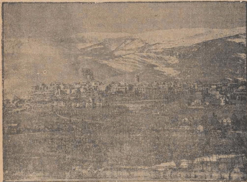
na pograniczu francuskim, które zostało jako ostatnie zajęte przez wojska gen. Franco. Słup dymu widoczny nad miastem pochodzi z eksplozji składu amunicji, podpalonego przez uciekających na stronę francuską milicjantów.