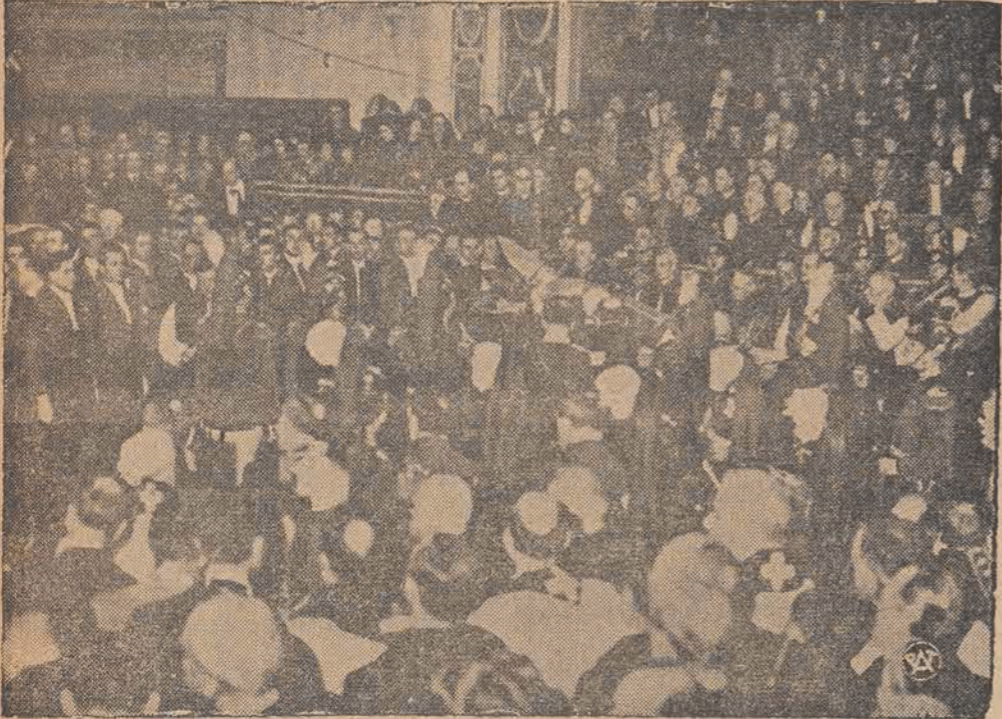
Rzut oka na uroczystości pogrzebowe Piusa XI, w chwili przenoszenia trumny do sarkofagu.