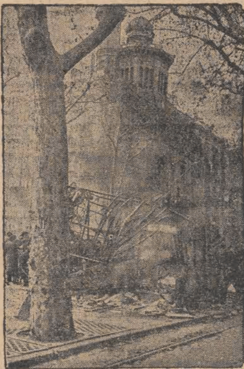
Na wzór Sowietów prowadziła w Barcelonie ekspozytura Kominternu na wielką skalę zakrojoną propagandę bezbożnictwa. Broszury propagandowe rozdawano w licznych specjalnie wzniesionych kioskach ulicznych. Obecnie po wkroczeniu wojsk powstańczej ludności zdemolowała i spaliła te kioski, które dla niej stały się symbolem krwawego ucisku