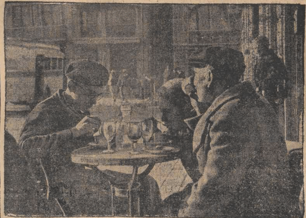
Typowe kawiarnie hiszpańskie w Barcelonie znowu zaczynają funkcjonować. Pomiędzy trzyletniego niemal terroru pod rządami anarchistów i komunistów, ludność po zajęciu stolicy przez powstańców wraca szybko do dawnych zwyczajów. Czarna kawa jest nieodzowną potrzebą każdego Hiszpana i Katalończyka, a dzięki niskim cenom można ją wypić przy stoliku ulicznym niezliczonych kawiarni.