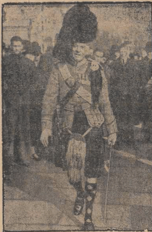
Podpułkownik szkockiego pułku udaje się w swym malowniczym uniformie Gordon-Highlanderów na doroczne przyjęcie, wydane przez króla Jerzego VI dla wyższych oficerów armii.