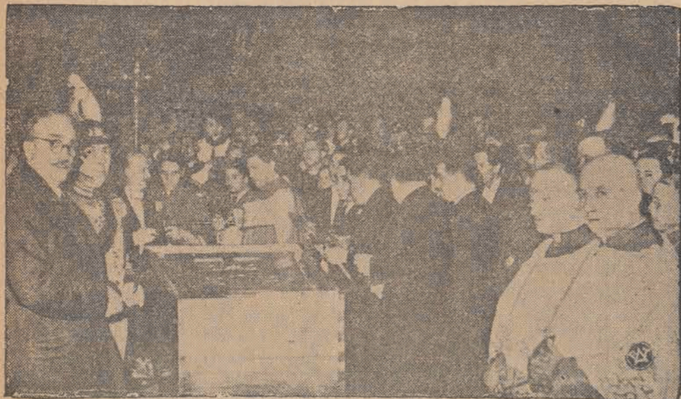
Moment zamurowywania sarkofagu, w którym spoczęły zwłoki Piusa XI.