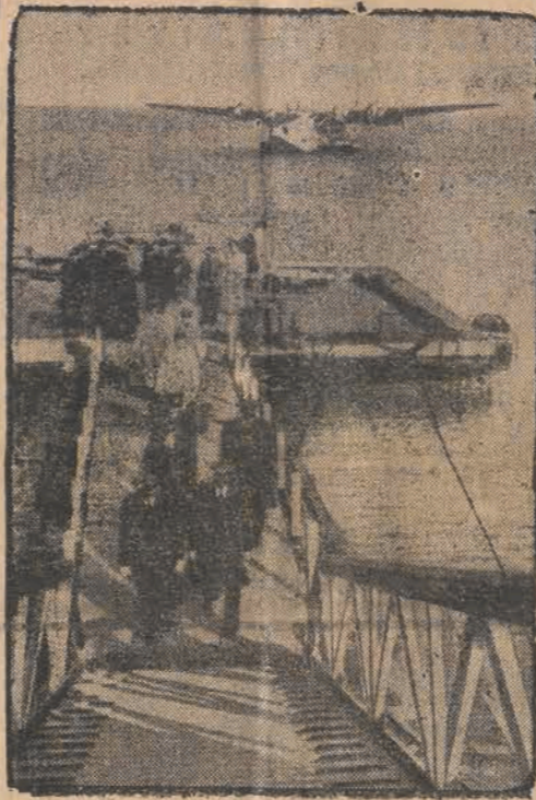
Do Lizbony przybył z Azorów olbrzymi amerykański samolot „Yankee Clipper” w drodze ze Stanów Zjednoczonych do Anglii. Ten latający statek mający komfortowe po mieszczenia dla 72 pasażerów i znacznej ilości poczty oraz towarów, będzie utrzymywał stałą komunikację między Europą a Ameryką. Na zdjęciu: „Yankee Clipper” na redzie przed portem w Lizbonie.