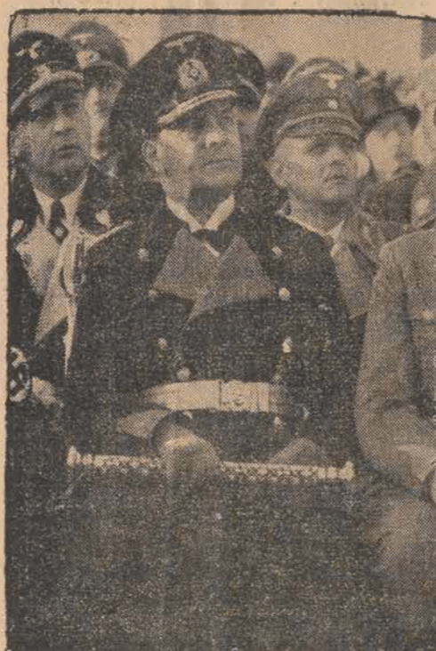
Dowódca floty niemieckiej admirał Raeder został mianowany „wielkim admirałem” (tytuł odpowiadający marszałkowi wojsk lądowych). Na zdjęciu: Wielki admirał Raeder z buławą marszałkowską.