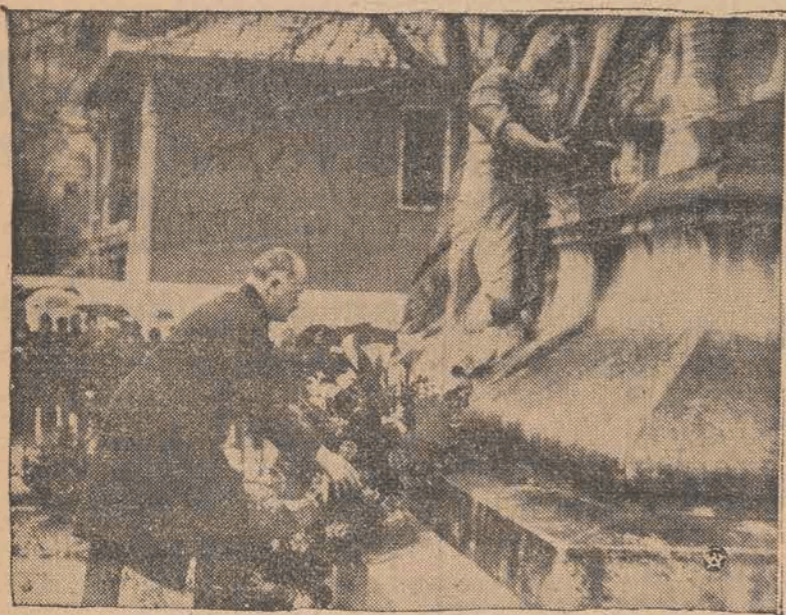
W Montelimar, we Francji odbyło się uroczyste odsłonięcie pomnika ku czci b. prezydenta republiki Emila Loubet. Na zdjęciu: Prezydent Lebrun składa wieniec u stóp pomnika prezydenta Emila Loubet w Montelimar. W uroczystości wzięli również udział członkowie rządu z premierem Daladier na czele.