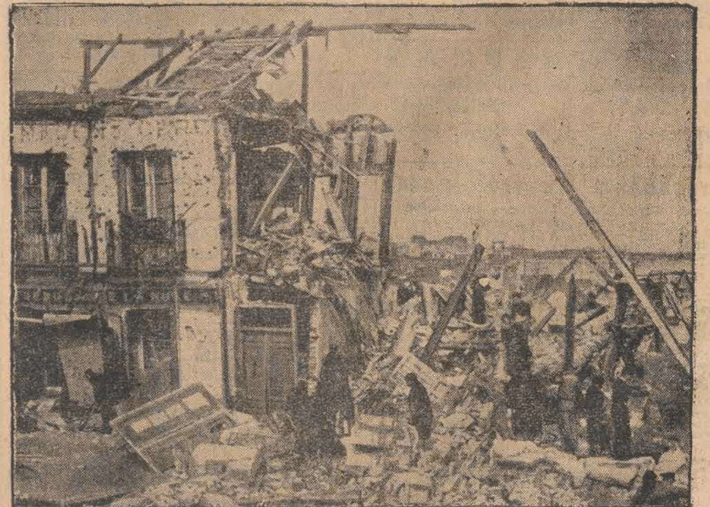
Zachodnie przedmieścia Madrytu zostały przez kilkuletnie boje niemal zupełnie zniszczone. Mieszkańcy, powracający obecnie do swych domostw szukają wśród gruzów resztek swego dobytku.

Kanały, porty, gmachy i urządzenia publiczne są pożytkiem dla świata. Ale flota wojenna jest koniecznością, bez której o jego niepodległym istnieniu mowy być nie może.