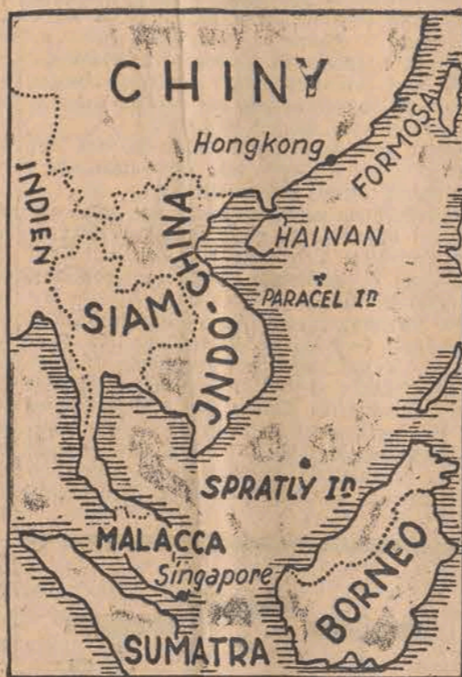
Rząd japoński ogłosił oficjalnie, że rząd wysp Spratly w połowie drogi z Hainan do Singapore oddał się pod opiekę Japonii.