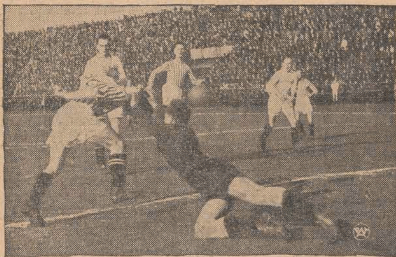
Fragment z meczu ligowego w Chorzowie między A.K.S. — Cracovia, zakończonego wynikiem 1:2. Widzimy moment gry przed bramką A.K.S.