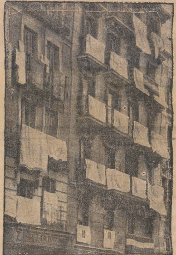
Oryginalne zdjęcie domów madryckich z momentu tuż przed wkroczeniem wojsk generała Franco. Wszystkie balkony pokryte były białymi prześcieradłami na znak bezwzględnej kapitulacji.