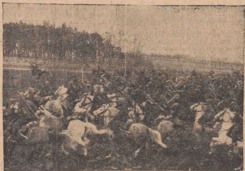
Szarża kawalerii polskiej.

WZMOCNIONE LOTNICTWO -WZMOŻONA POTĘGA POLSKI