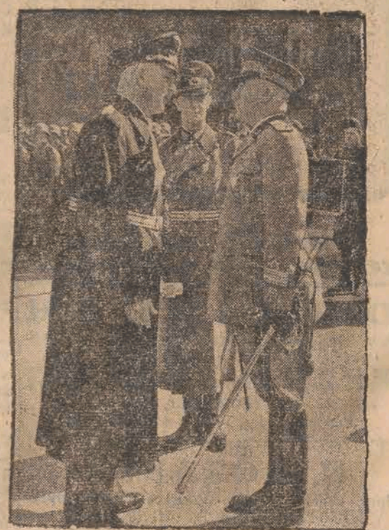
Szef włoskiego sztabu generalnego gen. Pariani (na prawo) reprezentował na obchodzie berlińskim armię włoską. Obok niego komendant Berlina gen. Seiffert.