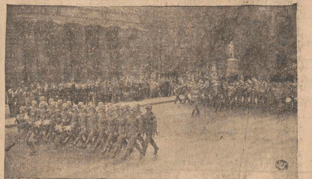
Defilada 80.000 żołnierzy w Berlinie w dniu wczorajszym.

PIERUSZY ŚCIGACZ MUSI BYĆ DAREM ŁODZI I WOJ. ŁÓDZKIEGO KONTO F.O.M. P.K.O. 42008