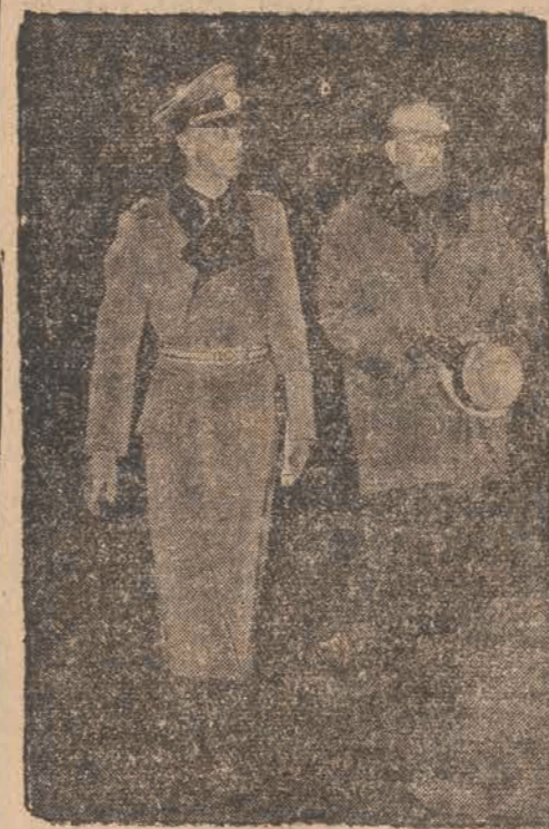
Generał Moscardo (na prawo) przybył do Berlina jako przedstawiciel gen. Franco.

Eskadry samolotów wojskowych przelatywały nad Berlinem podczas defilady przed kanclerzem Hitlerem.