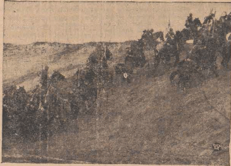
Kawaleria w czasie forsowania przystępnych terenów.