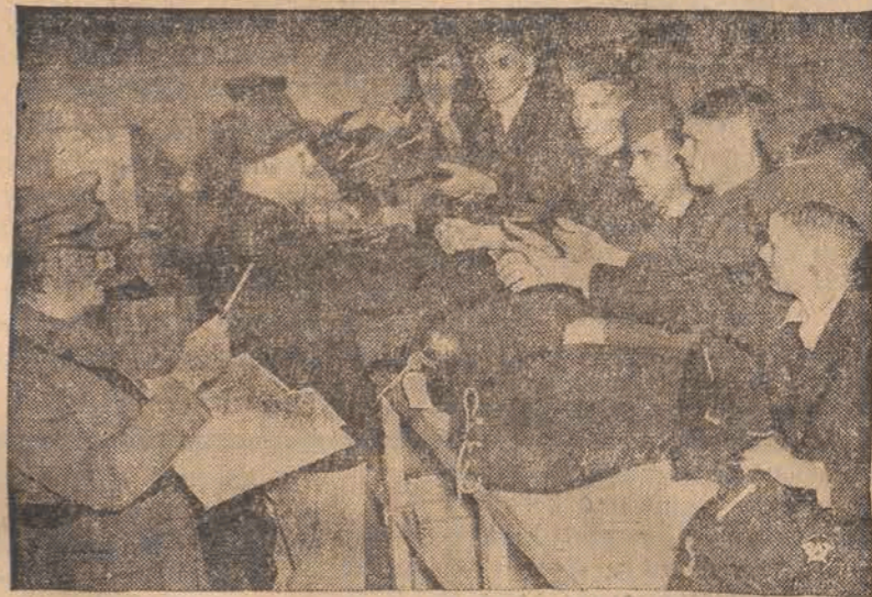
Ochotnicy do armii terytorialnej brytyjskiej otrzymują w biurach werbunkowych pełny ekwipunek wojskowy.