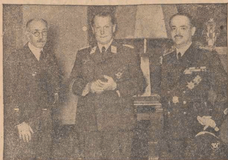
Wizyta w Berlinie premiera węgierskiego hr. Teleky i ministra Spraw Zagranicznych Węgier hr. Csaky. Na zdjęciu od lewej ku prawej: premier Teleky, feldmarszałek Goering, min. Csaky. W związku z pobytem węgierskich mężów stanu nad Szwecją, rezeszy się wczoraj pogłoski o planie podziału Słowacji między Niemcy i Węgry.