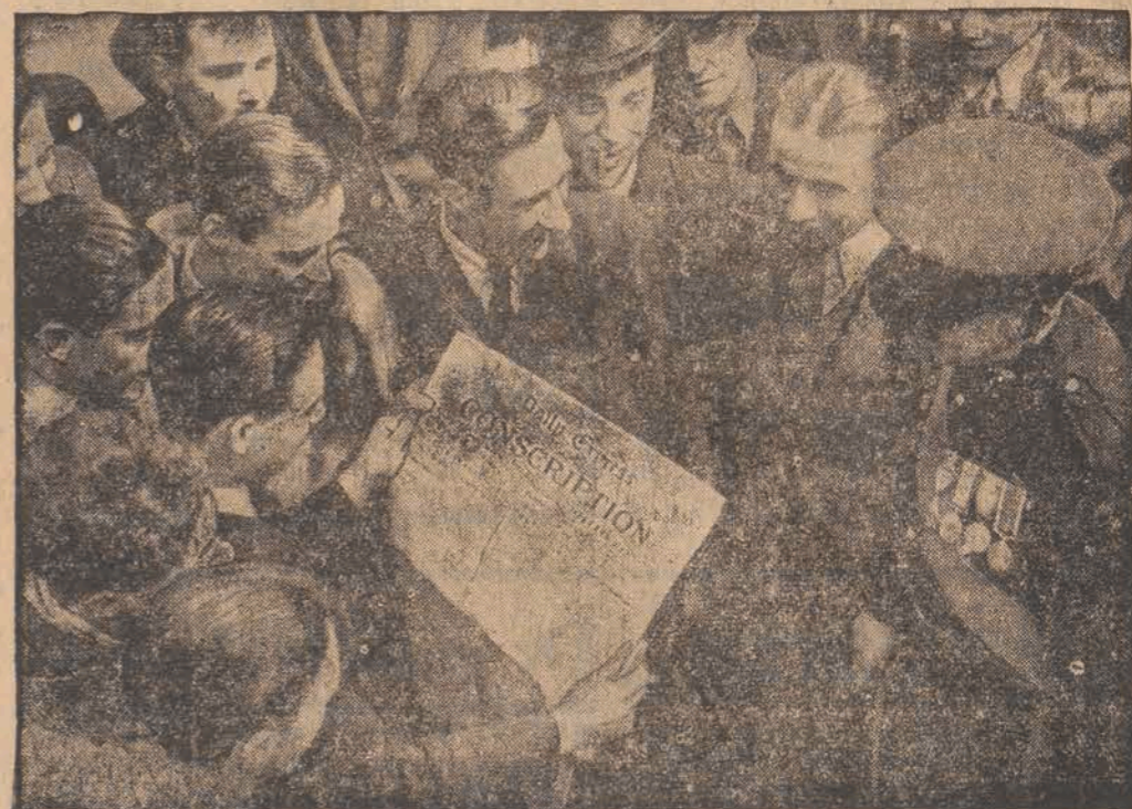
W biurach werbunkowych W. Brytanii wzmógł się bardzo napływ ochotników do służby stałej. Na zdjęciu widzimy ochotników czytających dziennik z zawiadomieniem o wprowadzeniu przymusowej służby 6-miesięcznej dla 20-letnich.