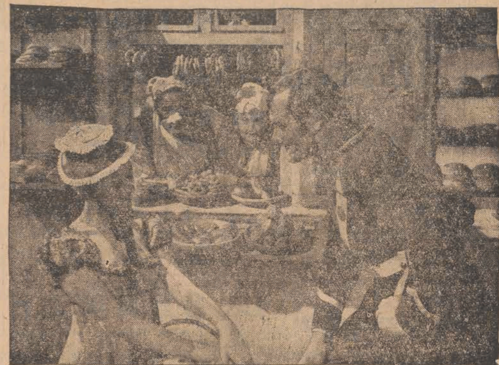
Żołnierz z czasów napoleońskich rozmawia z rozkoszną markietanką.