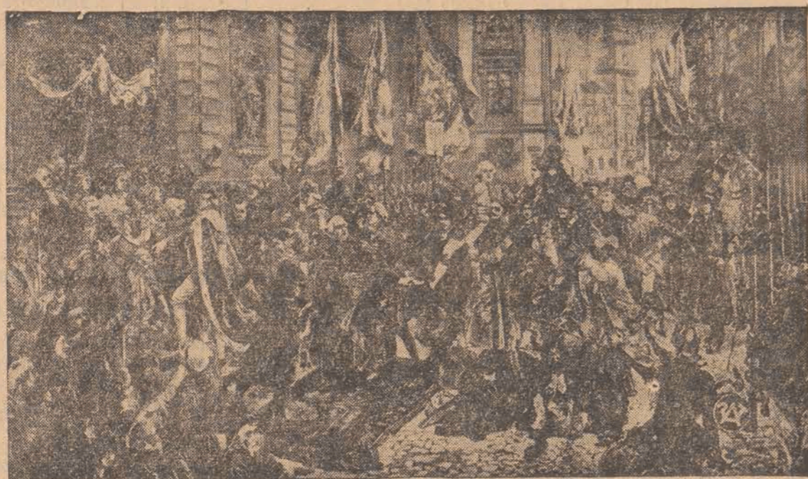
Jan Matejko: Uroczysty pochód postów Sejmu z Zamku do Katedry Św. Jana na dziękczynne nabożeństwo po uchwaleniu konstytucji 3-go Maja 1791 r.