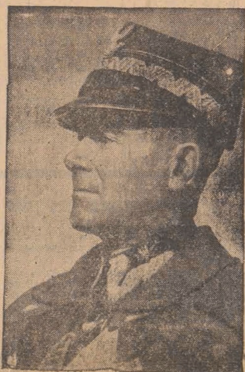
Naczelnny Wódz Marszałek Polski Edward Śmigły-Rydz, dookoła którego w tych historycznych chwilach skupia się cały naród polski bez względu na przekonania polityczne.