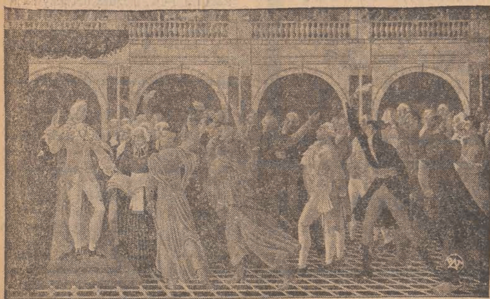
Bractwo Św. Łukasza: KONSTYTUCJA 3-go MAJA. (wspólne dzieło 11 członków Bractwa Św. Łukasza, które wraz z 6-ma innymi obrazami, ilustrującymi najważniejsze momenty z historii Polski, zostało zawieszona w sali honorowej pawilonu polskiego na wystawie światowej w Nowym Jorku).