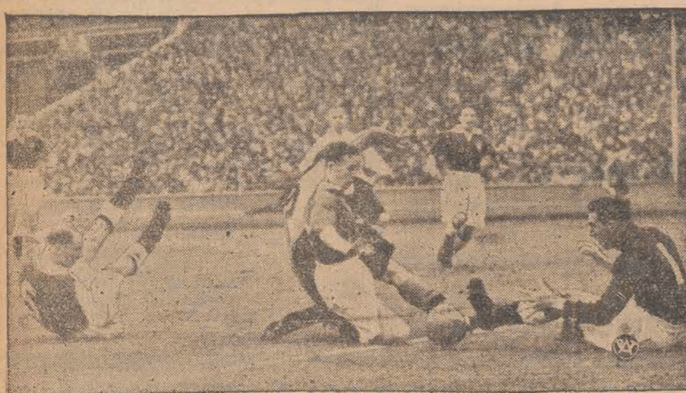
Na stadionie w Wembley odbył się sensacyjny mecz piłkarski o mistrzostwo Wielkiej Brytanii między drużynami Portsmouth i Wolverhampton. Mecz zakończył się nieoczekiwanym zwycięstwem drużyny Portsmouth w stosunku 4:1, która zdobyła po raz pierwszy puchar Anglii. Sensacyjnym tym zawodom przyglądało się przeszło 100.000 widzów, wśród których był król Jerzy VI wraz z rodziną królewską. Na zdjęciu efektowny moment gry pod bramką Portsmouth.