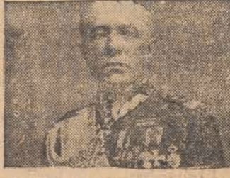
Gen. broni Leon Berbecki

mamy do spełnienia obowiązku. Każdy Polak musi subskrybować Pożyczkę Obrony Przeciwlotniczej.