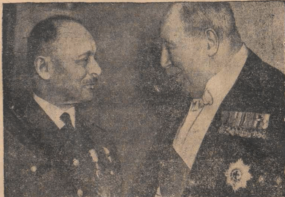
B. szef francuskiego sztabu generalnego generał Weygand (na lewo) w rozmowie z lordem Derby (na prawo) podczas przyjęcia na cześć francuskich gości w londyńskim hotelu Dorchester.