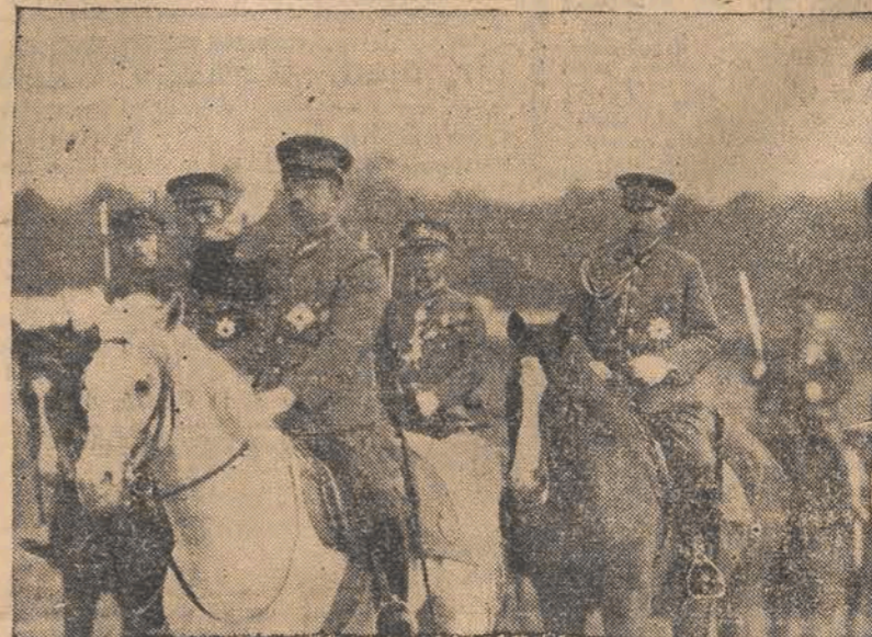
Cesarz Japonii Hirohito — w towarzystwie swych adiutantów podczas przeglądu oddziałów wojskowych.