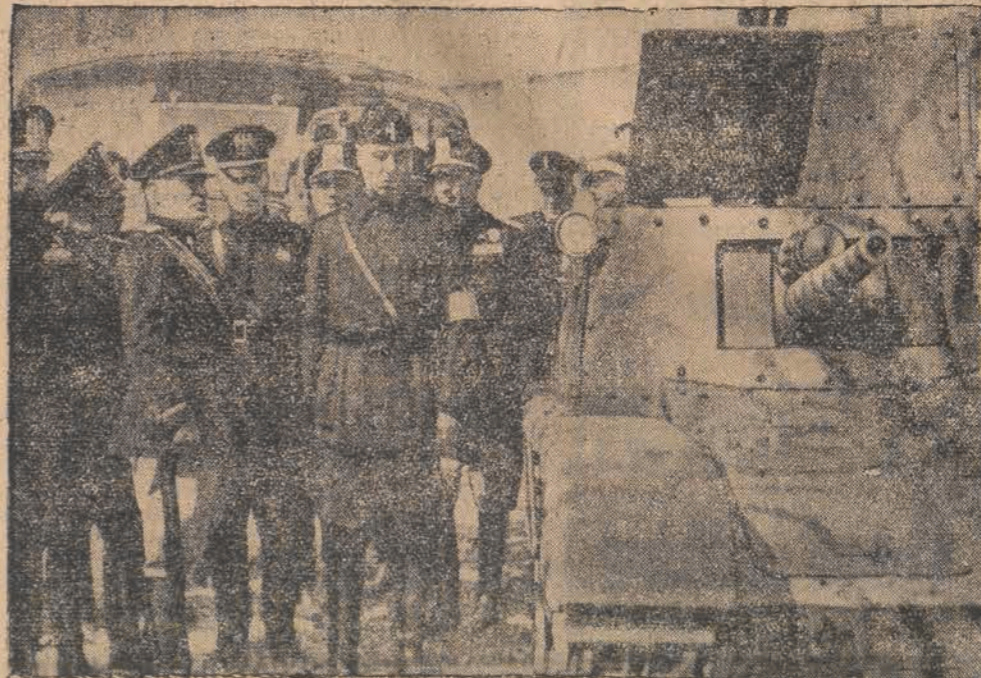
W obecności 50.000 robotników odbyło się poświęcenie nowych zakładów Fiata w Mirafiori. Na zdjęciu widzimy Mussoliniego, oglądającego nowy tank produkcji Fiata.