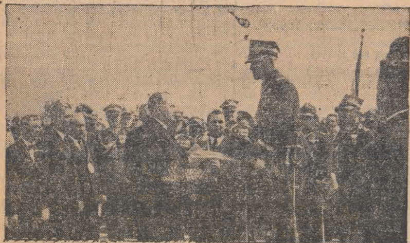
Moment wręczenia Naczelnemu Wodzowi przez starostę Oborskiego dyplomów obywatelstwa honorowego wszystkich jednostek samorządu miejskiego i gminnego pow. Ciechanowskiego.