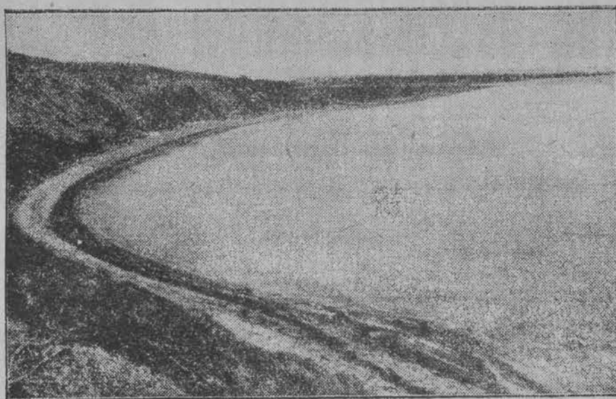
Miejsce, gdzie bierze początek kanał Suezki.