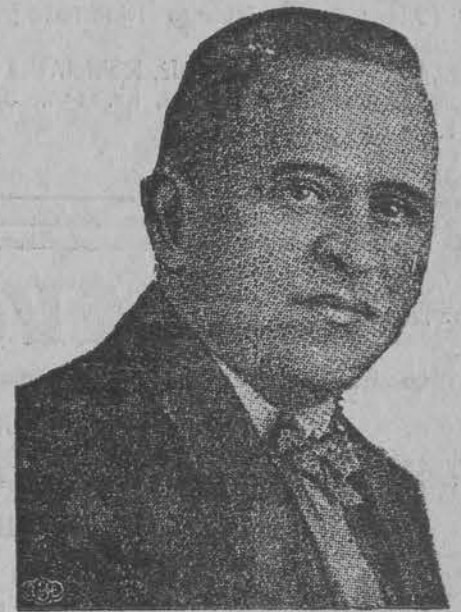
Inżynier Henryk Mianowski, wybitny działacz społeczny, znawca spraw szkolnictwa zawodowego.