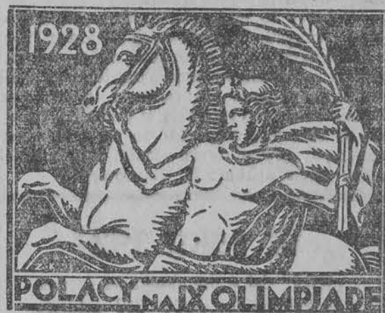
1928 POLACY NA OLIMPIADĘ