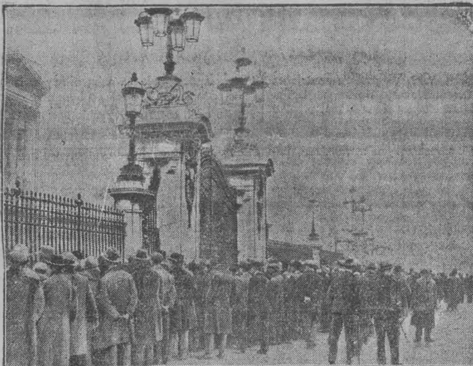
Przed bramą pałacu królewskiego w Londynie zbierają się codziennie tłumy ludzi, oczekujących na ukazanie się biuletynu o stanie zdrowia króla Jerzego V.