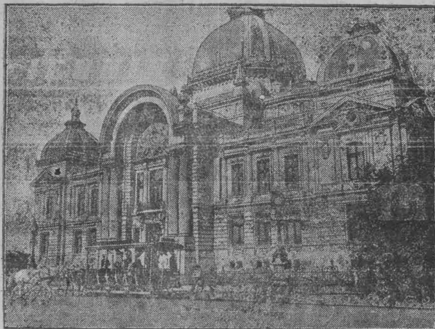
Gmach parlamentu rumuńskiego w Bukareszcie.

Rokowania te idą bardzo opornie, Chamberlain narazie ręką w rękę z Briandem, broni się przed zupełną przegraną.