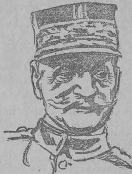
MARSZAŁEK FOCH. smiertelnie chory.