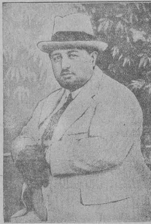
TRZYDNIOWY KRÓL AFGANISTANU.

Położenie Bachi-Sakao w Kabulu chwilowo jest pomyślne. Pobite wojska byłego rządu nie mogą dla niego być groźne.