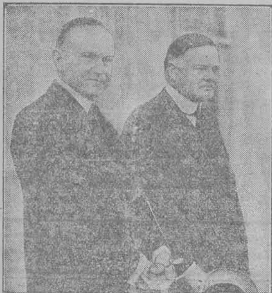
Coolidge ustępujący i Hoover, który w dniu 4 b. m. wprowadza się do Białego Domu.