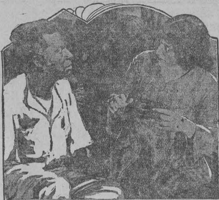
CASSIE learns the identity of 'UNCLE TOM' - Scene from 'UNCLE TOM'S CABIN' - A UNIVERSAL MASTERPIECE

Nad program: F A R S A i Aktualności Nad program