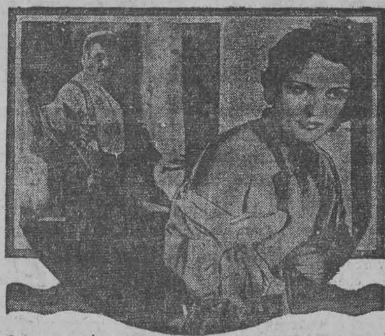
Scene from the FBO production „THE RED SWORD”

Hulaszce życie oficerów ca skiej gwardji. Tragedja shańbionej kobiety przez carskich siepaczy. Niepospolita treść! Koncertowa gra! Silne napięcie! Już wkrótce kino „PALACE”