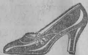
Fantofel spacerowy zł. 34.50.