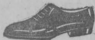
Męski pantofel lak. brązowa, czarna-szyte zł. 36.90.

Wobec tego przed kupnem bucika proszę odwiedzić mój nowoczesny MAGAZYN OBUWIA egz. od 1903 r. PIOTRKOWSKA 161