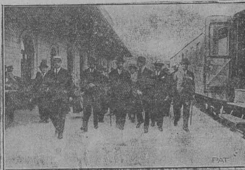
Wracającego min. Przemysłu i Handlu witają na Dworcu Głównym przedstawiciele władz.