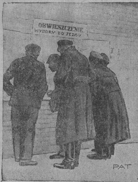
Ruch przedwyboreczy już się rozpoczął. Ludność studjuje z zainteresowaniem ukazujące się obwieszczenia władz.