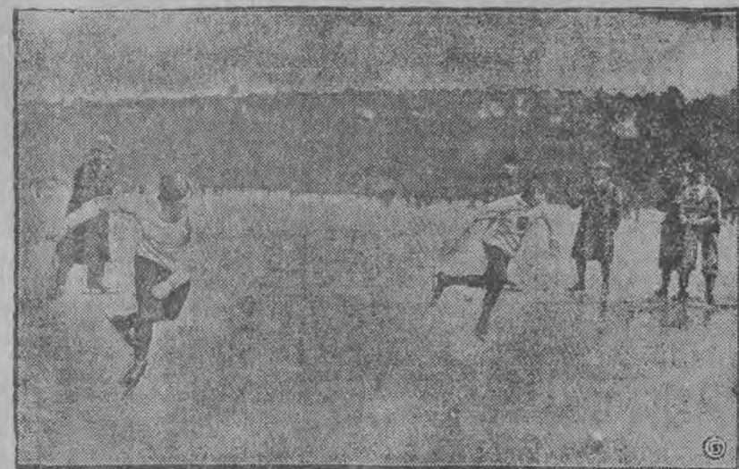
Start dwóch tuzów i łyżwiarskich w Davos.