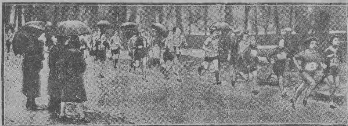
O pierwsze miejsce toczyła się przez cały czas zacięta walka i dopiero przy mecie faworytka wysunęła się o kilka metrów naprzód