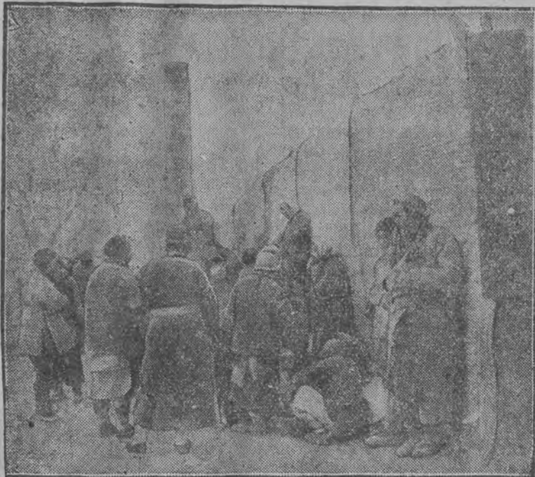
Ludność miasteczek, uciekając przed następującą armją południową, obozuje pod gołym niebem