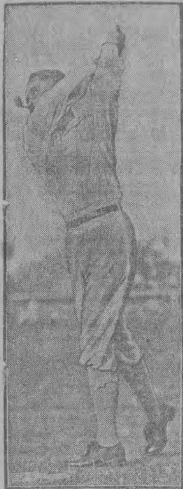
Rama VI, król Sjamu, wprowadza w swoim kraju sporty.