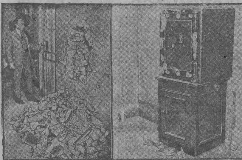
Jak poszukiwano dokumentów