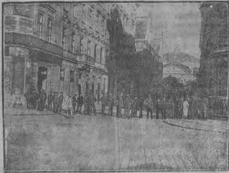
Ruiny hotelu i ulica w Berggieshübel po powodzi.

Ze świadectw historycznych widać, że trzęsienia ziemi w Palestynie, aczkolwiek katastrofalne, nie należą na szczęście do największych w dziejach... W tym samym okręgu morza Śródziemnego notuje historia o wiele większe katastrofy wulkaniczne pochodzący od trzęsienia ziemi, połączonego w wybuchem Wezuwiusza, w roku 79 po Chrystusie, które zniszczyło Pompeje, Herkulanum i