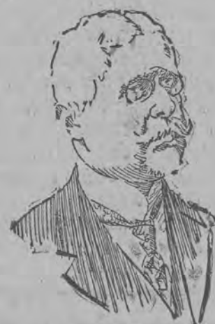
Dr. Schober, którego ustąpienia domagała się socjaldemokracja austriacka.