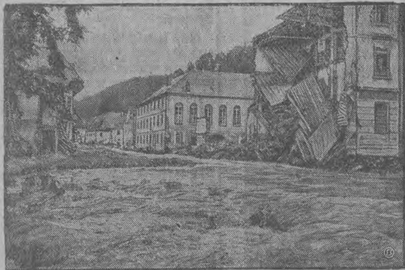
Dom zrujnowany przez potężne fale

W powiecie sieradzkim związek komunalny asygnował 20.000 złotych na rozpoczęcie budowy boisk. W Łodzi specjalna komisja zakwalifikowała 22 placów miejskich oraz 3 placów prywatne jako nadające się na boiska. Łączna powierzchnia tych placów wynosi 114.639 metrów kw. Wydział gospodarczy magistratu przygotowuje obecnie kosztorysy robót ziem-