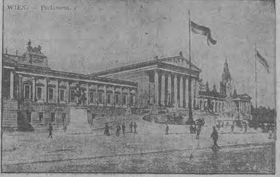
Tutaj, na stopniach gmachu przedstawicielstwa ludowego, ustawili barykady walczący robotnicy