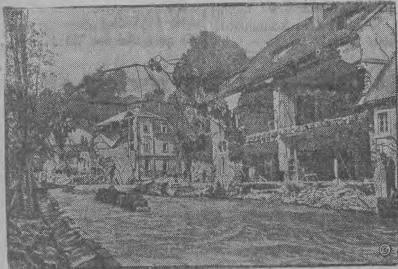
Straszny widok zrujnowanego domu w pobliżu miasta Gottlenby

(n) Po wielkiej serji katastrof, jakiej widownią był glob ziemski w lecie i w jesieni roku ubiegłego, oraz na wiosnę roku bieżącego — rozpoczął się obecnie dla świata nowy „letni“ okres klęsk żywiołowych.