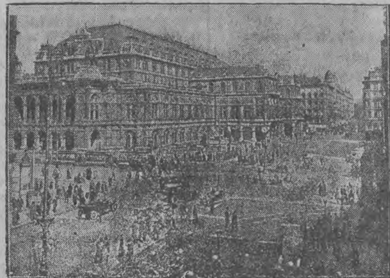
Ilustracja nasza przedstawia jedną z najpiękniejszych ulic Wiednia — „Opfering”.