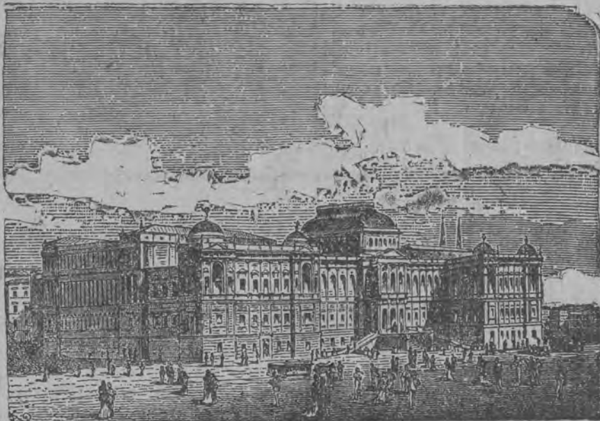
Tutaj doszło do pierwszych starć między demonstrantami a policją