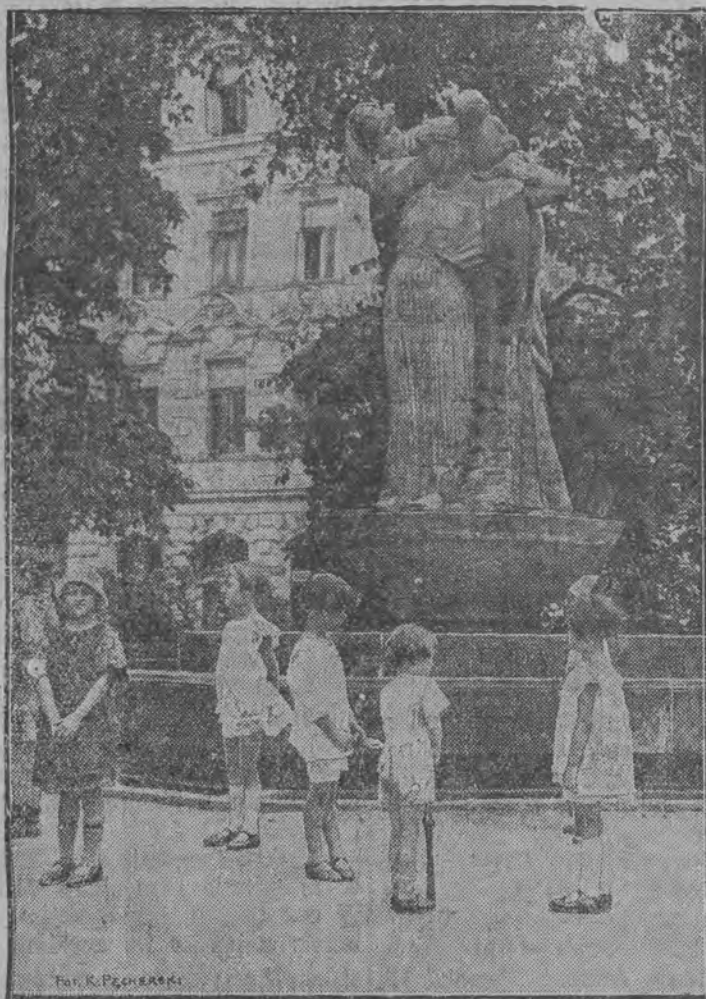
Miejsce, na którym widziano po raz ostatni więźnia z Antokolu.