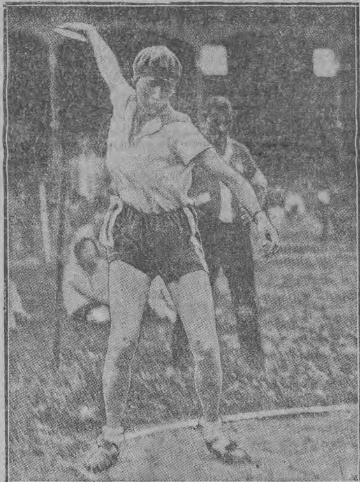
Panna Halina Konopacka pobita podczas pięcioboju lekkoatletycznego w Agrikoli dwa rekordy światowe w rzucie dyskiem je dnorącz 39 m. 18 ctm. i oburącz 64 m. 60 ctm.