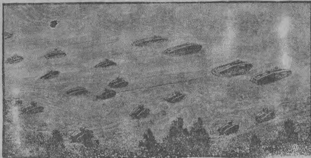
Oddział czołgów, głęboko uszykowany czyni wyłom w terenie.

Czołg, jako broń zaskoczenia, użyty w wojnie światowej — wykazywał tak wielkie zalety, że po wojnie wszystkie państwa żywo zainteresowały się tym nowym rodzajem broni towarzyszącej.