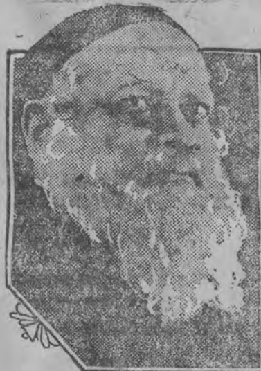
Rudolf SCHILDKRAUT genjalny artysta teatru Reinhardta, wystąpi wkrótce w największym, monumentalnym arcydziele filmowym p. t.