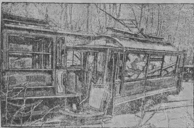
Rozbite wozy tramwajowe na ulicy w niemieckim mieście Kassel